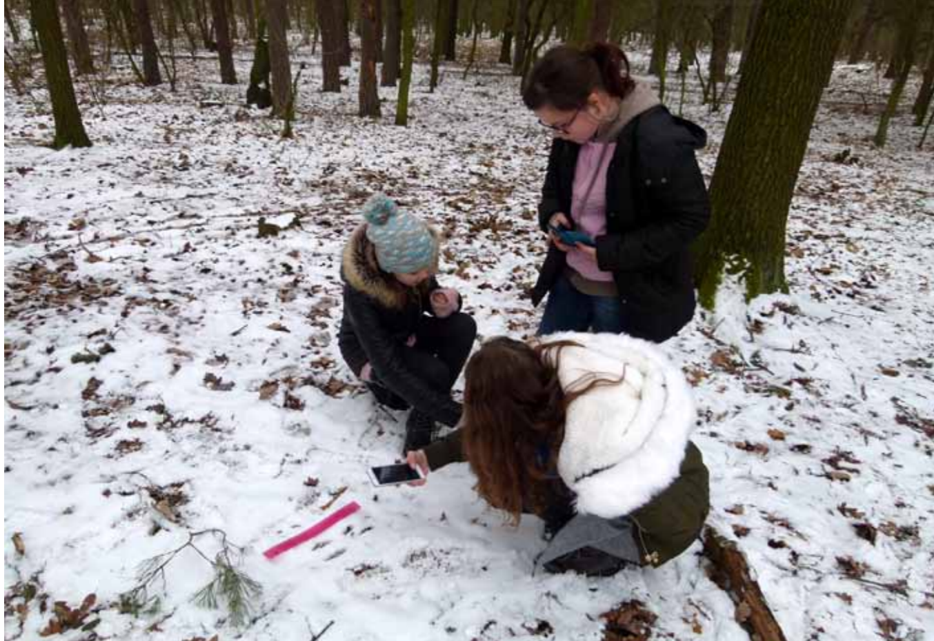
Jak daleko doskočí veverka?