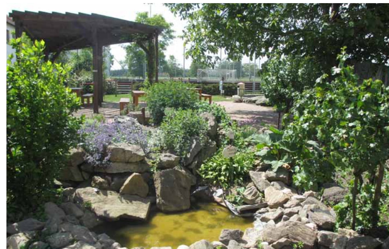
Exkurze na ukázkovou školní zahradu ZŠ Myslibořice

Tématu školních zahrad se už řadu let věnují některá střediska EVVO, seznam doporučených publikací najdete v kapitole Zdroje informací a inspirace.