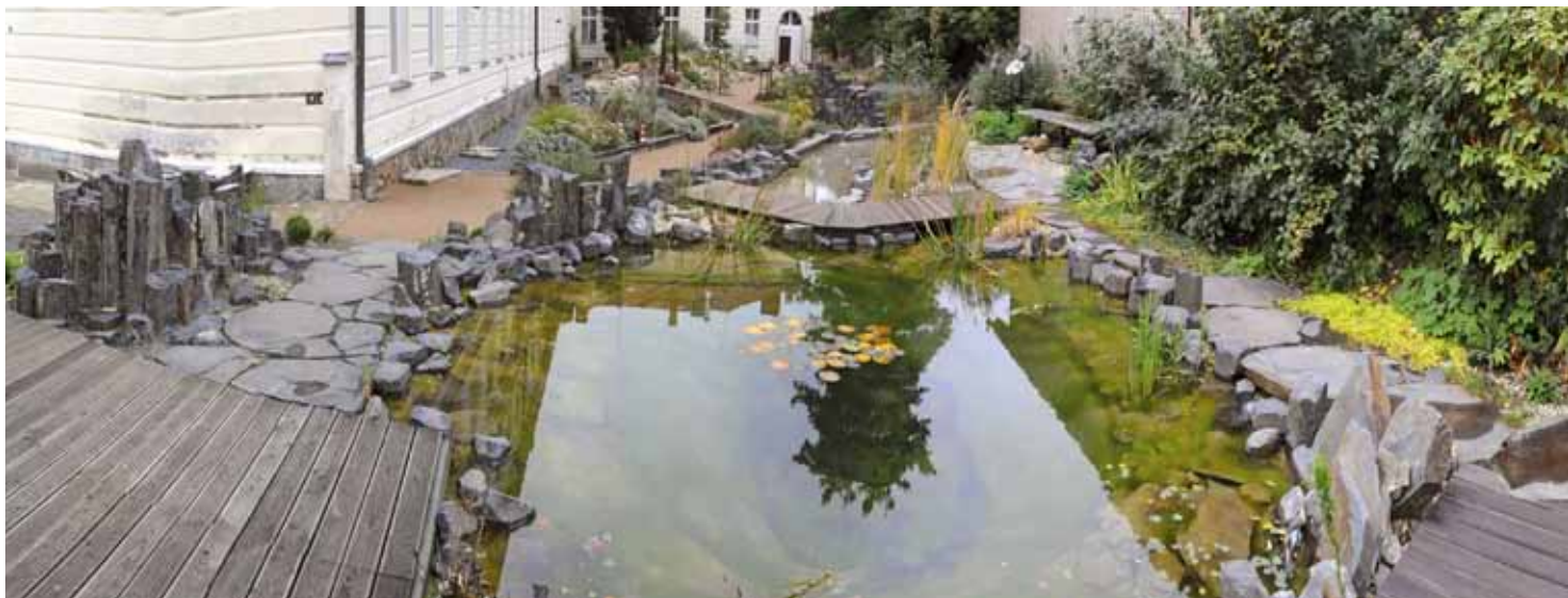
Didaktické centrum geologie Muzea Říčany slouží pro výuku žáků i pedagogů.

Podporujeme moderní vzdělávací trendy a mezi pedagogy šíříme nové vzdělávací metody.