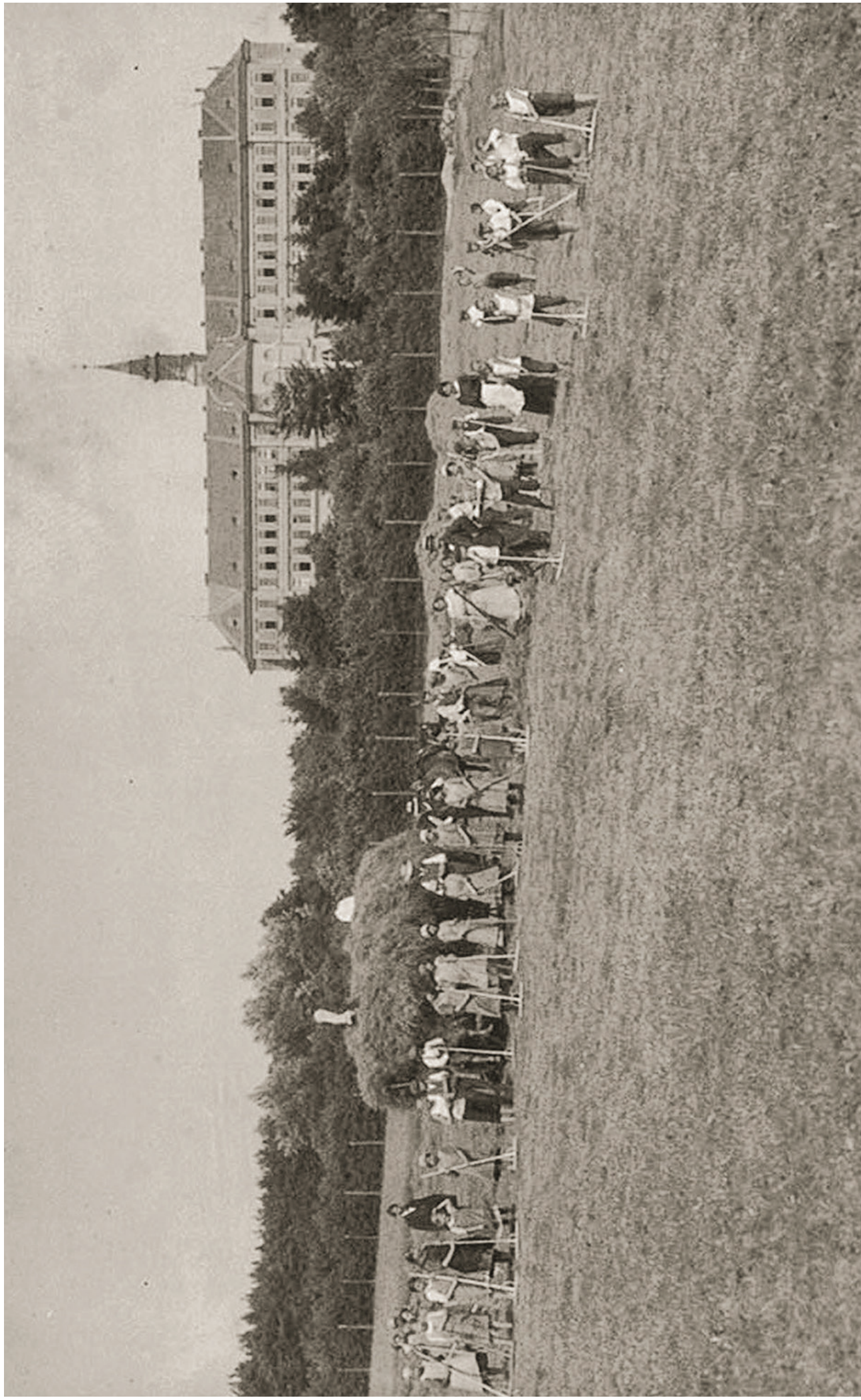
ZEMĚDĚLSKÉ PRÁCE V OKOLÍ OLIVOVNY, ZAČÁTEK 20. STOLETÍ