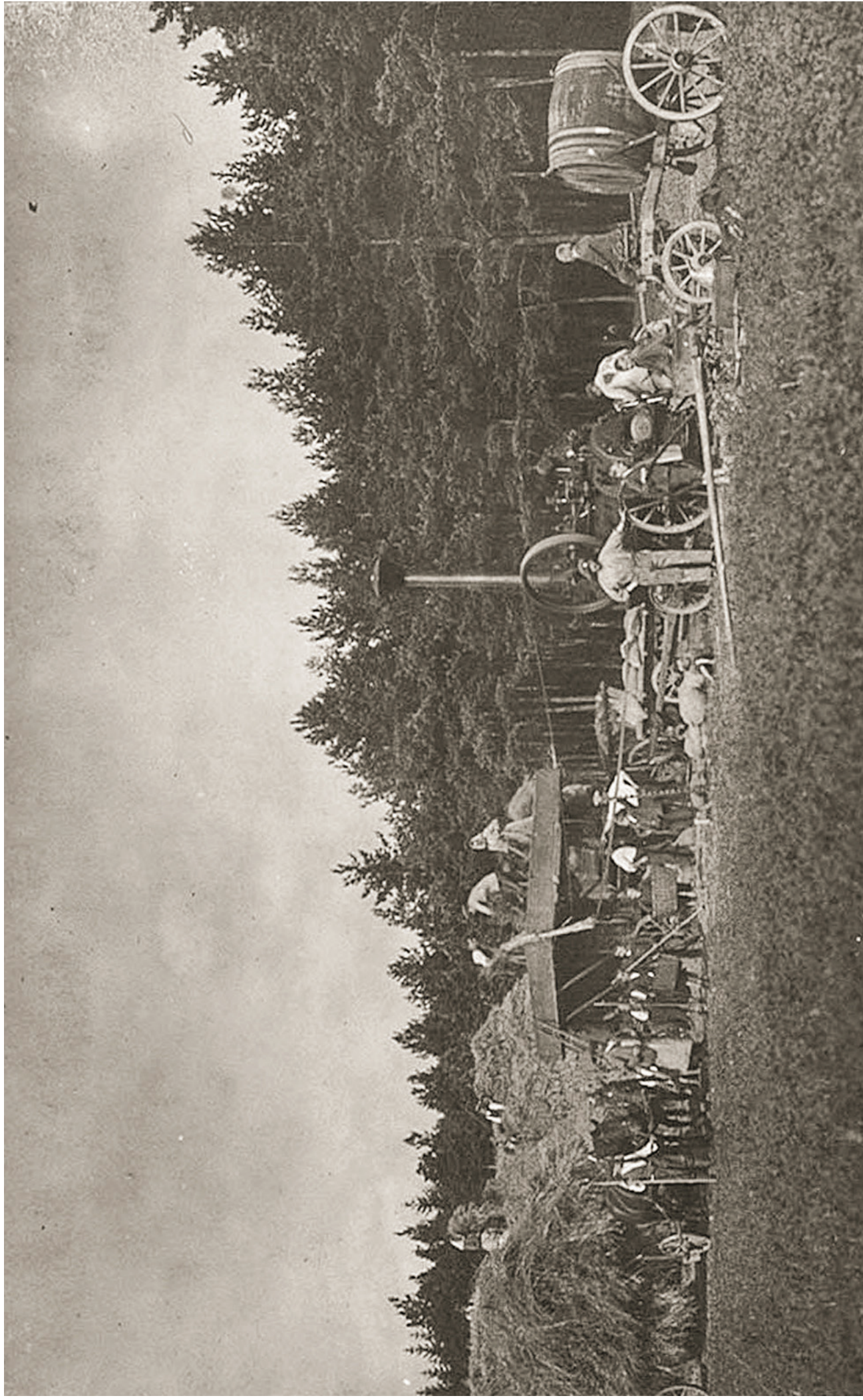
ZEMĚDĚLSKÉ PRÁCE V OKOLÍ OLIVOVNY, ZAČÁTEK 20. STOLETÍ