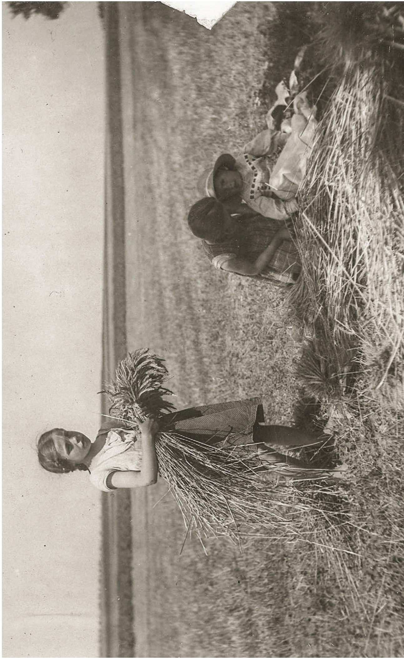
MALÍ POMOCNÍCI NA POLI V OKOLÍ ŘÍČAN, ASI TŘICÁTÁ LÉTA 20. STOLETÍ