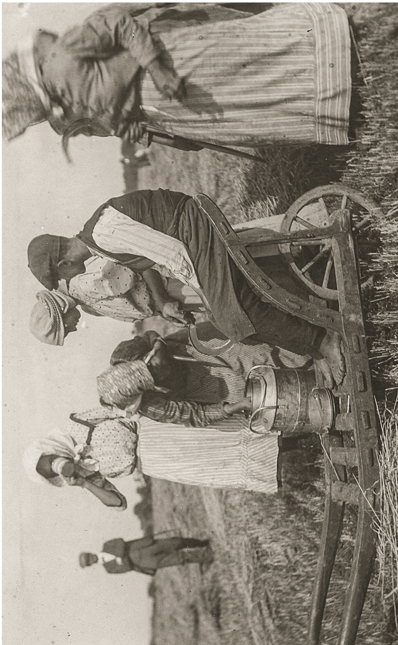
CHVÍLE ODDYCHU O ŽNÍCH NA ŘÍČANSKU, ASI TŘICÁTÁ LÉTA 20. STOLETÍ