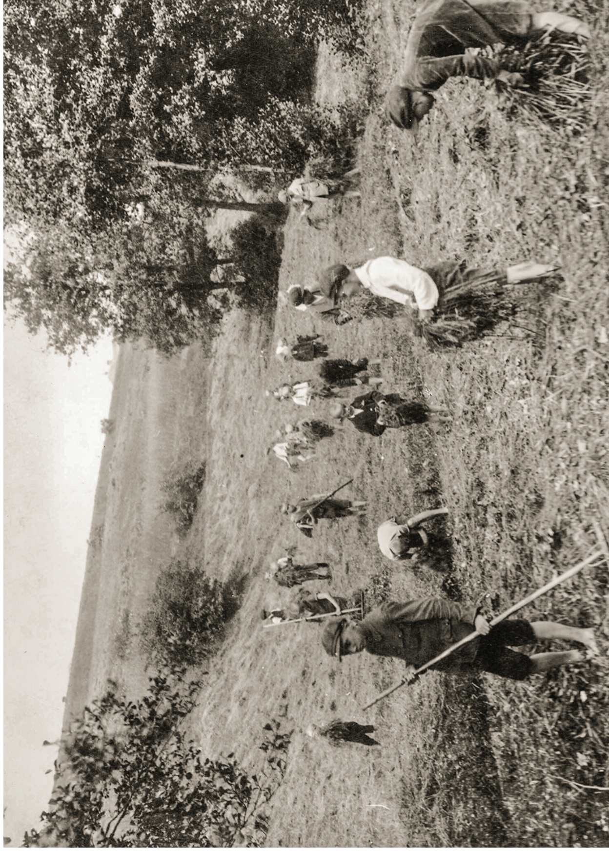
ZEMĚDĚLSKÉ PRÁCE V OKOLÍ OLIVOVNY, ZAČÁTEK 20. STOLETÍ.