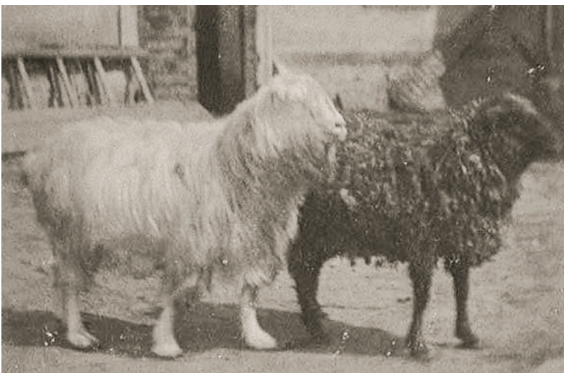
ZEMĚDĚLSKÉ PRÁCE V OKOLÍ OLIVOVNY, ZAČÁTEK 20. STOLETÍ