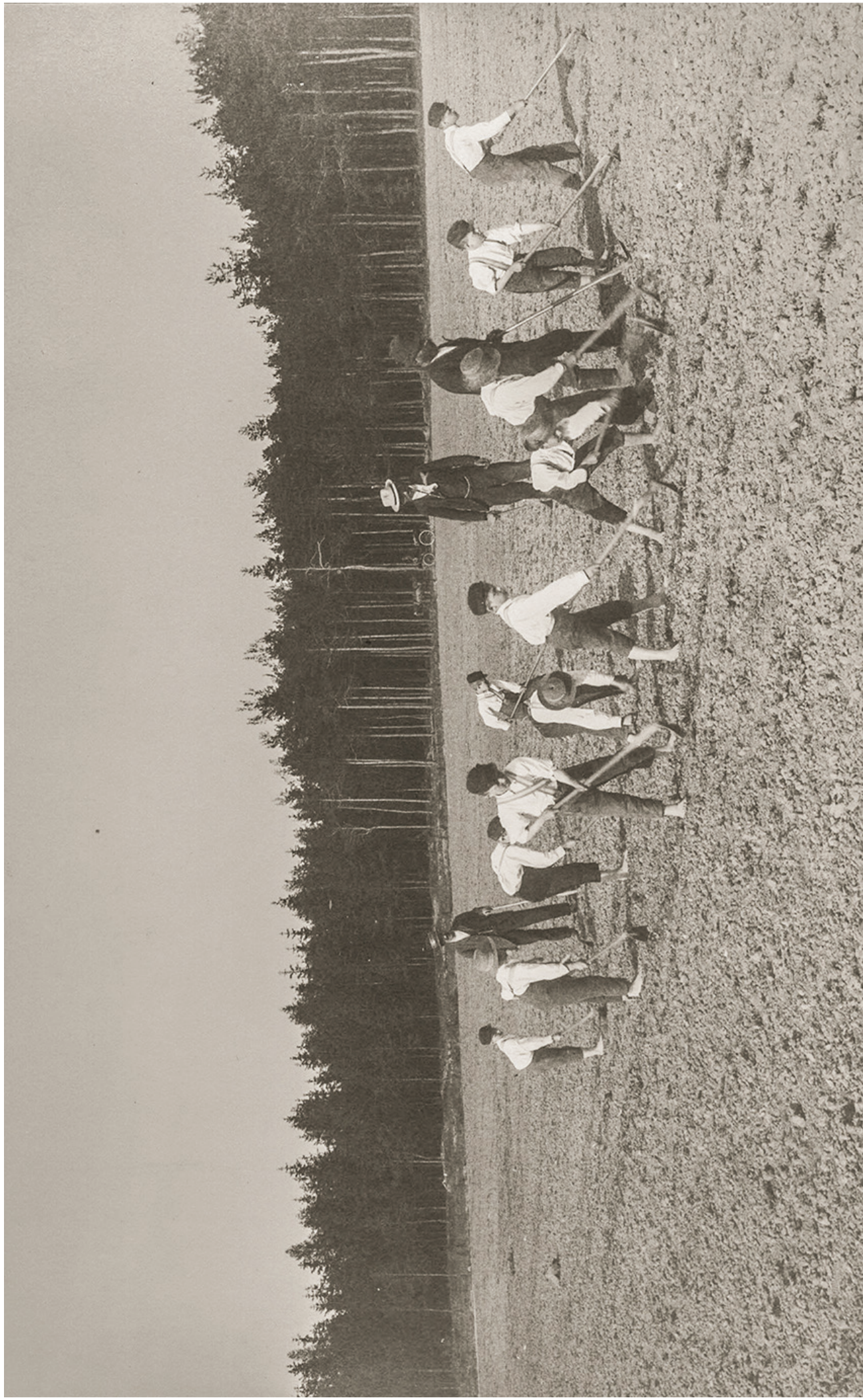
ZEMĚDĚLSKÉ PRÁCE V OKOLÍ OLIVOVNY, ZAČÁTEK 20. STOLETÍ