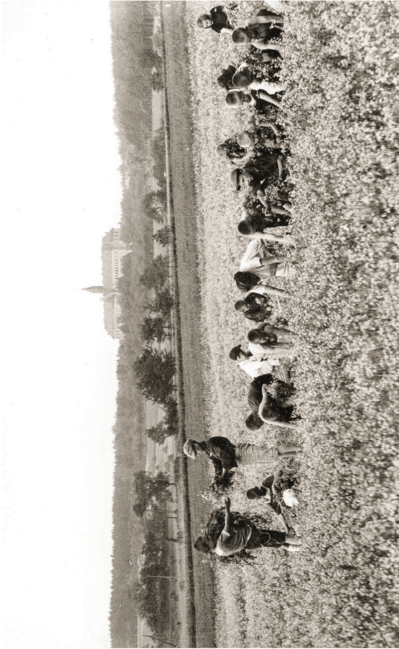
ZEMĚDĚLSKÉ PRÁCE V OKOLÍ OLIVOVNY, ZAČÁTEK 20. STOLETÍ