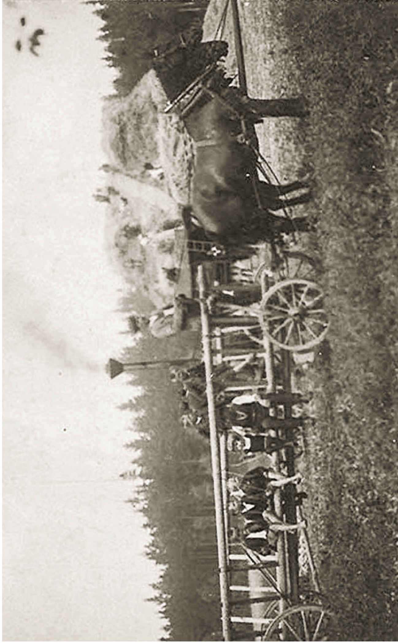
ZEMĚDĚLSKÉ PRÁCE V OKOLÍ OLIVOVNY, ZAČÁTEK 20. STOLETÍ