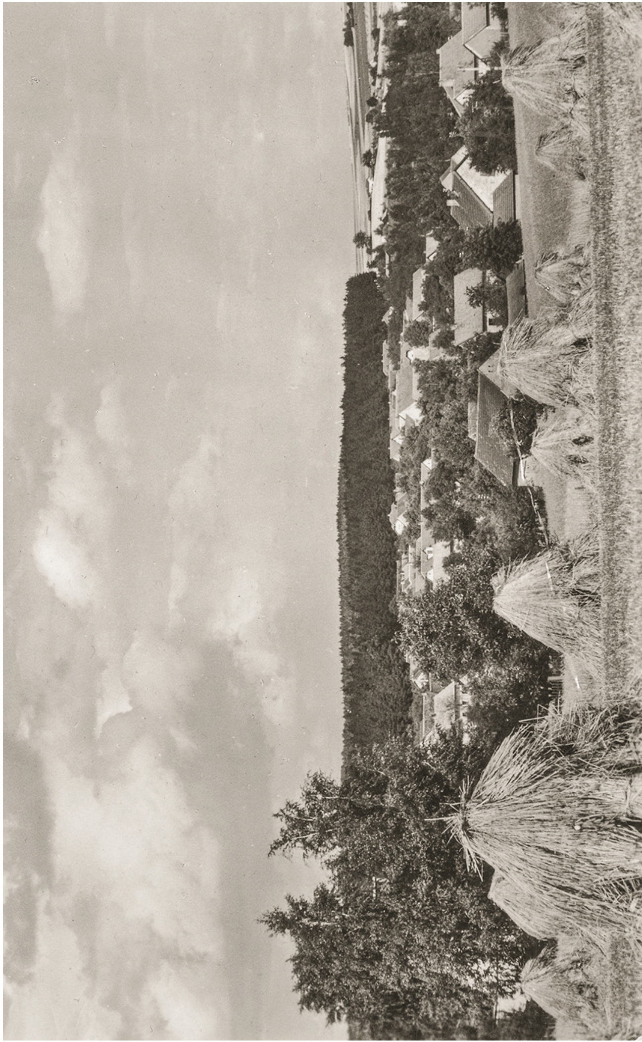
POHLED KE SVĚTICÍM, ŠEDESÁTÁ LÉTA 20. STOLETÍ