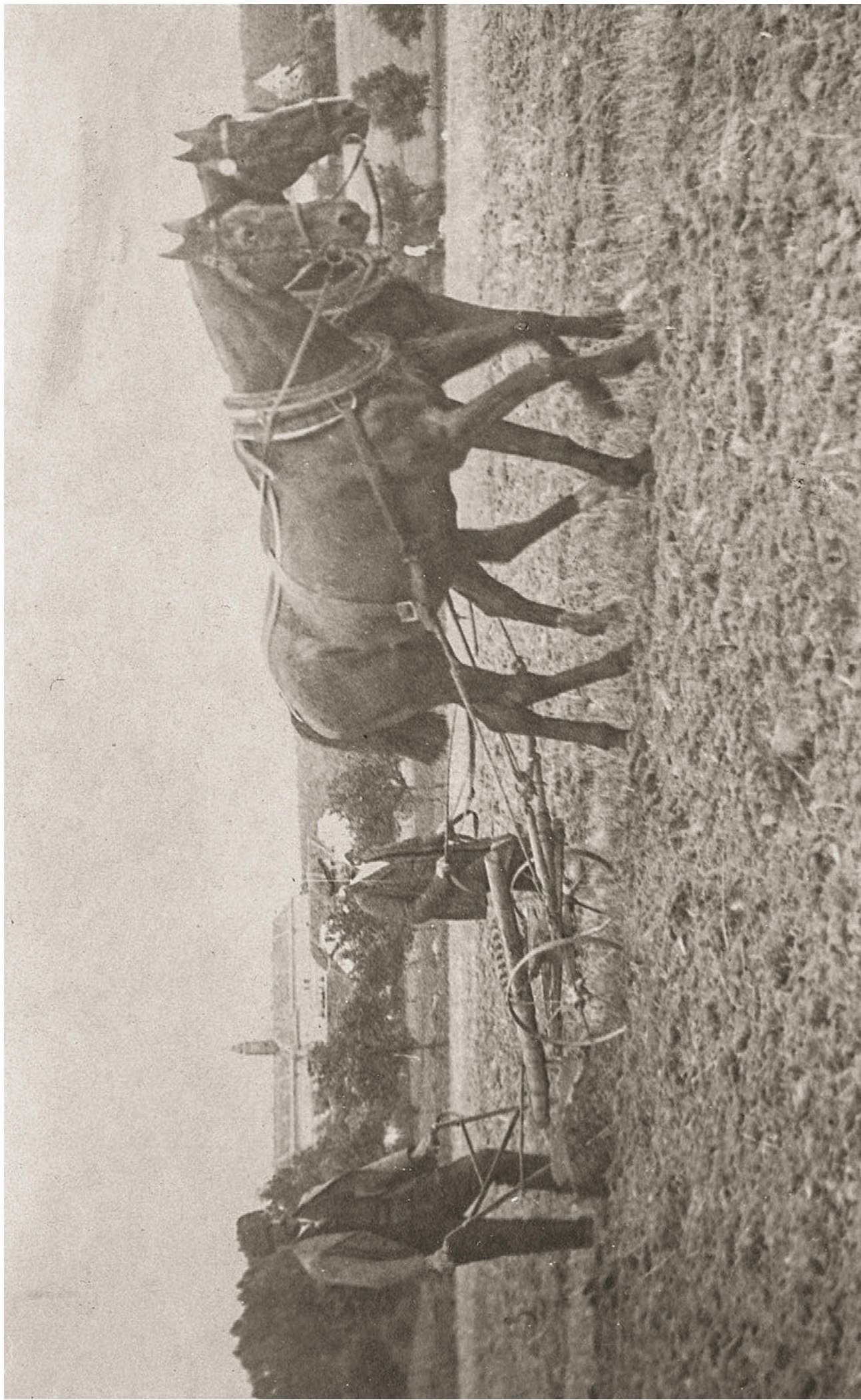
POLNÍ PRÁCE (ORBA) U RADOŠOVIC, PŘED DRUHOU SVĚTOVOU VÁLKOU