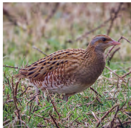
Chřástal polní patří mezi ubývající druhy Evropy a jeho život je velmi málo známý. Žije skrytě na loukách a v polích, odkud ani po vyrušení obvykle nevzlétne