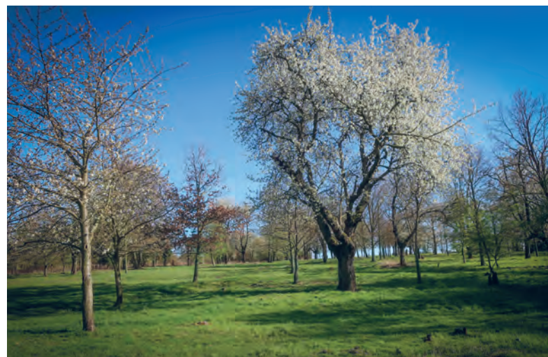
Dnešní třešňovka cestou z města ke skautské klubovně