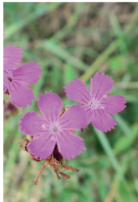
Kartouzek roste spíše na suchých mezích, kohoutek na vlhkých loukách

Ve vzpomínkách nejstarších obyvatel Říčan zůstávají také pestré louky , na jaře plné květin, které bylo potřeba na začátku léta pokosit a usušit. Pod Marvánkem nedaleko chovných rybníků, kde už dnes stojí domy (v ulicích Řípská, V Chobotě) byla dřív louka, kterou vlastnil místní farní úřad.