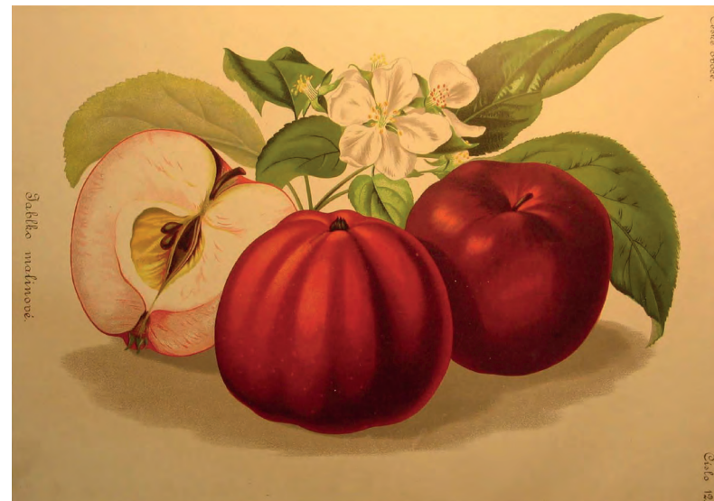
Ilustrace z knihy České ovoce – Jablka