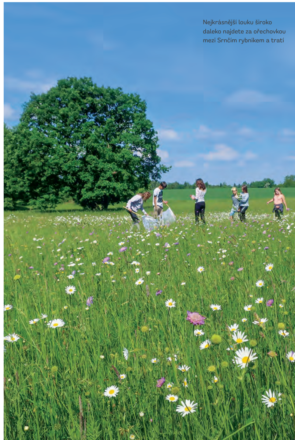
Nejkrásnější louku široko daleko najdete za ořechovkou mezi Srnčím rybníkem a tratí