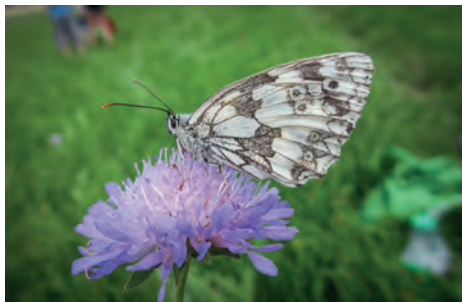
Okáč bojínkový na chrastavci

Louce dominuje starý dub s několika kmeny. Je to místo, kde se lidé setkávají nebo kde hledají samotu a klid. V jeho koruně často odpočívají ptáci a motýli, ale vejde se sem i velká skupina uličníků.