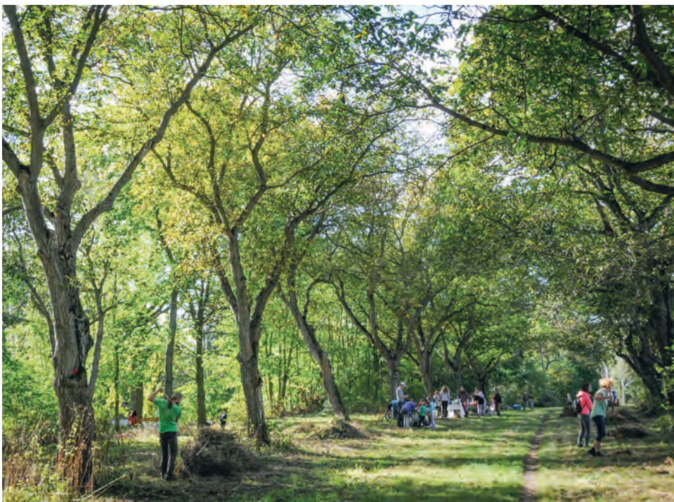
Posečené kopřivy a brhlíci dobrovolníci shrabou a hromadu odvezou ke zkompostování

Kromě třešní a jablek se v krajině zachovaly i ořešákové aleje. O jednu takovou ořechovku pečuje Ekocentrum Říčany a pořádá tu na podzim sousedskou ořechovou slavnost. Staré ořešáky mají různé dutiny, které k hnízdění využívají sýkory nebo brhlíci. Sídli tu i letní kolonie netopýrů, kteří loví komáry a jejich larvy z vodní hladiny přilehlého Srnčího rybníka a nádrže Rozpakov.