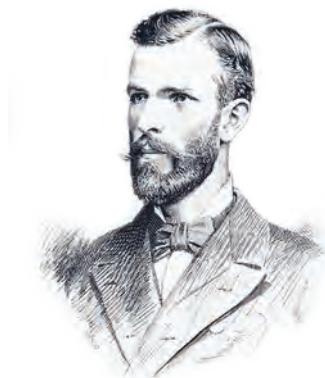
František Josef Thomayer

Thomayer se roku 1901 stal předsedou Okrašlovacího spolku pro Říčany a Radošovice a jeho zásluhou probíhala úprava cest, vysazování stromů, keřů a květin a pořádaly se květinové slavnosti.