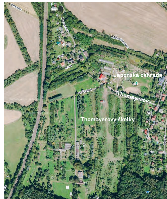
Letecký pohled na dnešní podobu Thomayerových školek, které sousedí s Japonskou zahradou