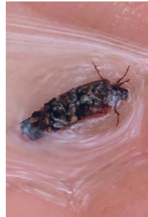
Přítomnost larev chrostíků ukazuje čistotu vod (tzv. bioindikace). Pozorovat je můžete nad jezem

Do Rokytky také přichází voda přes čistírnu odpadních vod v Tehovci, která musí odstraňovat znečištění nejen z domácností, ale také například z průmyslových provozů u Černokostelecké silnice. Na Rokytky tak můžete potkat často nevábně vyhlížející chuchvalce pěny, z kterých jen některé mají přirozený původ v huminových kyselinách z okolních rašelinných lesů.