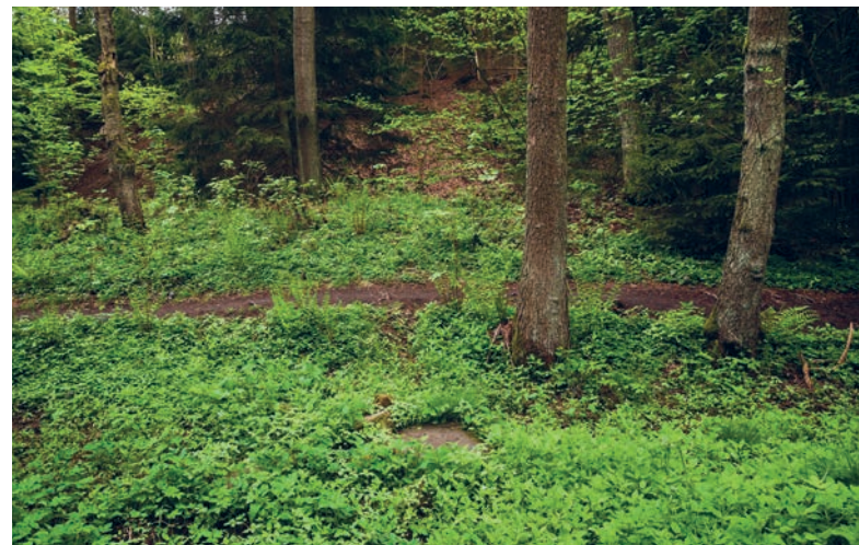
Místo, kde se nacházelo lesní divadlo, dnes připomínají jen betonové základy nápovední budky