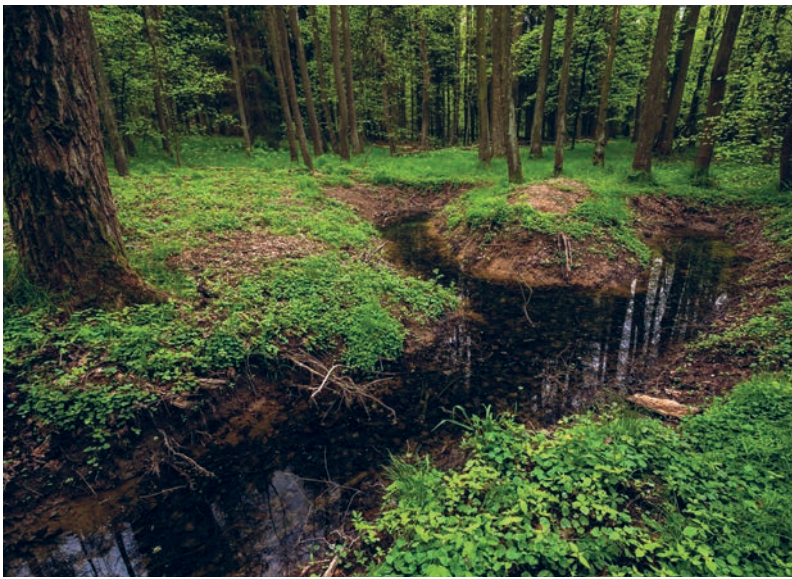
Nově vybagrovanou tůňku hned první rok zabýdly stovky pulců

Rokytky nad Jurečkem protéká lesem přes žulové balvany a její břehy lemují kapradiny a kozlíky. Tok Rokytky v místě, kde se vlévá do Vltavy, v minulosti nejspíš lemovalo vrbové proutě (staročesky „rokyti“). Podle něho dostala svůj název, který je doložen už v Kristiánově legendě. Rokytky napájí chladnou vodou nejen Jureček, ale je zdrojem vody i pro staré koupaliště (místní mu říkají koupadlo nebo Starák). Voda do něj vtéká od jezů, u kterých můžete sejít z hlavní cesty a pokračovat přímo podél potoka.