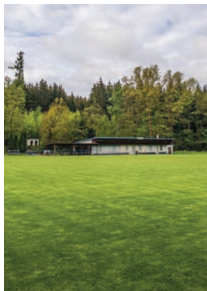
Fotbalové hřiště dnes

Radošovice, na jejichž území Jureček leží, se staly vyhledávaným cílem výletů i místem pro letní byty Pražanů díky železnici vystavěné v sedmdesátých letech 19. století. Okolní lesy a louky lákaly k procházkám a později i ke koupání. První malé koupaliště, tzv. staré koupadlo , vzniklo v lese už v roce 1904. Rybník na Rokytce zřídila obec ve dvacátých letech, koupaliště uvedla do provozu v srpnu 1934.