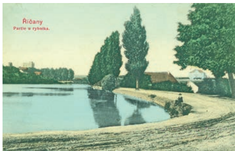
Mlýnský rybník na začátku 20. století

Mlýn býval obecní a po třicetileté válce panský. Patřily k němu polnosti a v minulosti dokonce tři rybníky (kromě Mlýnského také Lázeňský a Bezděkov, který se nacházel do 19. století v dnešní lokalitě na Fialce pod nádražím). Stavení pod hrází rybníka i s náhonem je zakresleno už na plánu Řičan z roku 1715 včetně toho, že rybník má mlýn v názvu. Na konci 19. století byl mlýn majetkem Spolkové rolnické továrny na cukr v Uhříněvsi, proto se s výškou hladiny rybníka manipulovalo podle potřeby uhříněveského cukrovaru. V roce 1898 si ho pronajala rodina Menclova. Začalo se mu pak říkat Menclův mlýn.