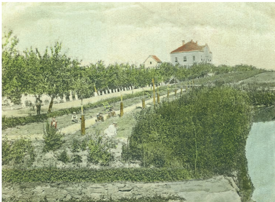
Pohled od kraje Mlýnského rybníka ke Kolovratské silnici na začátku 20. století

Na samém kraji ulice Podhrázská stojí dům, dříve statek rodiny Šobrov. Za první republiky jim patřilo největší povoznictví v této části Říčan