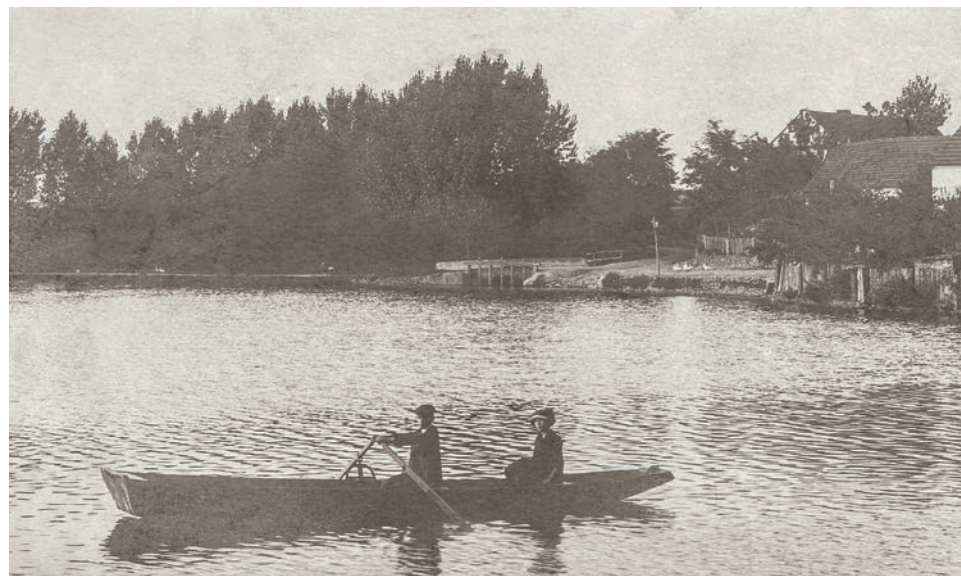
Lodičky na Mlýnském rybníku