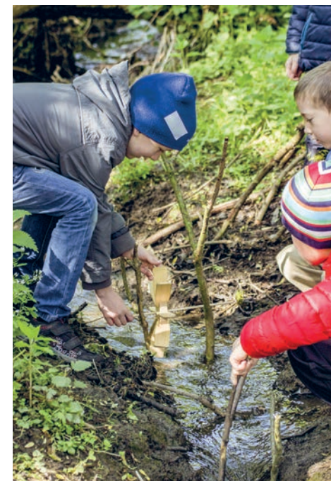
Fotografie z výukového programu Muzea Říčany Pod našimi okny

Inspiraci od šikovných tatínků a dětí najdete na potoku za rybníkem kolem dřevěné lávky i dál směrem na Kolovraty.