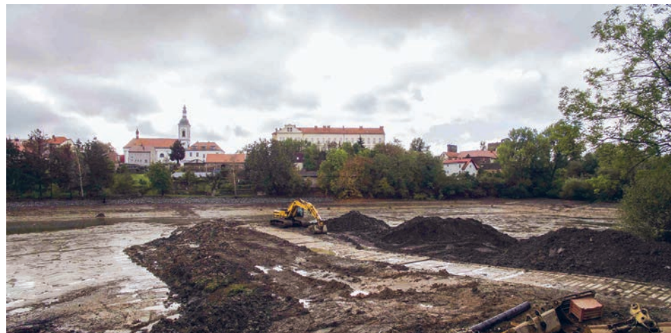
Odbahnění Mlýnského rybníka po povodních v roce 2013