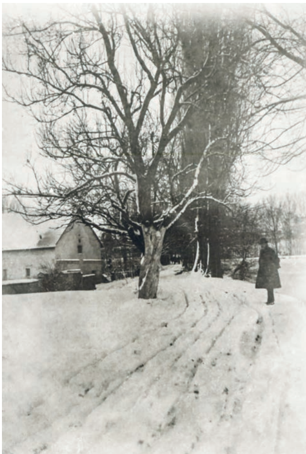
Mlýn v zimě 1931