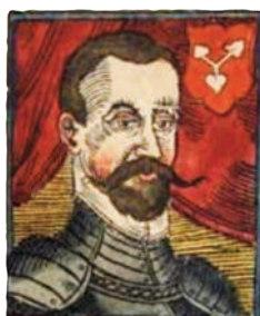
Fiktivní portréty Oldřicha (nahore) a Jimrama z Říčan ze 17. století z Diadochu Bartoloměje Paprockého z Hlohol a Paprocké Vůle