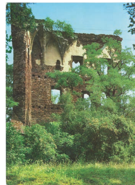
Pohled na dnes již neexistující klenební žebra paláce, sedmdesátá léta 20. století