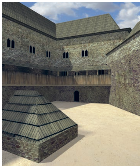
V roce 2020 vznikla vizualizace středověké podoby říčanského hradu, která je ke shlédnutí na Youtube kanálu Muzea Říčany

Jak říčanský hrad v době své největší slávy mohl vypadat? Okolí hradu obklopovaly dva rybníky, Mlýnský a dnes už zaniklý Lázeňský. Na východní straně navazovalo na hrad městečko s kostelem, které suplovalo jeho hospodářské zázemí. Od tohoto městečka hrad odděloval příkop. Samotný hrad měl patrně vnější (parkánovou) hradbu a vyšší hradbu vlastního jádra. Do ní byla zakomponována velká věž, brána, palác a patrně i další palácové nebo hospodářské stavby. Palácová stavba byla nepochybně opatřena dřevěnou pavlačí, která usnadňovala komuni-