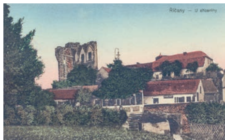
Záběr z míst, kde je dnes parkoviště. Z domků pod hradem dnes stojí už jen jediný, ten nejvíce vpravo

Teprve od 19. století se hrad začíná vnímat jako památka a už nedochází k jeho soustavnému poškozování. Stává se místem výletů i inspirací pro umělce a jejich díla. V průběhu 20. století dochází k sanaci hradního paláce, ovšem ani ta v roce 1991 nezabránila zřícení klenby hradního paláce. V době zcela nedávné došlo k šetrnému zabezpečení hradní věže, která byla do té doby chráněna nevzhlednou kovovou sítí.