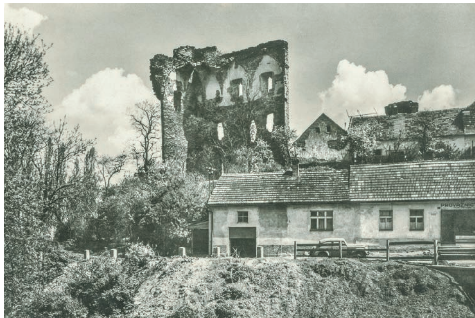
Fotografie hradu z padesátých let 20. století. Vpravo dole domek s provaznictvím

„Dnešním výrostkům rozhodně nedoporučuji to, co jsme prováděli my jako patnáctiletí kluci. Tehdy jsme se dokázali vyšplhat až na vrchol zchátralého hradního paláce, fotografovali jsme se tam a rozhlíželi. Jen pohled, který se nám naskytl!“