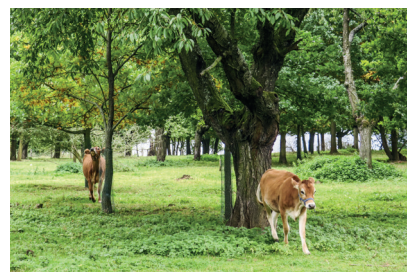
Stará Třešňovka u skautské klubovny je dnes oplocená, pasou se tam krávy a ovce z tehovské farmy.