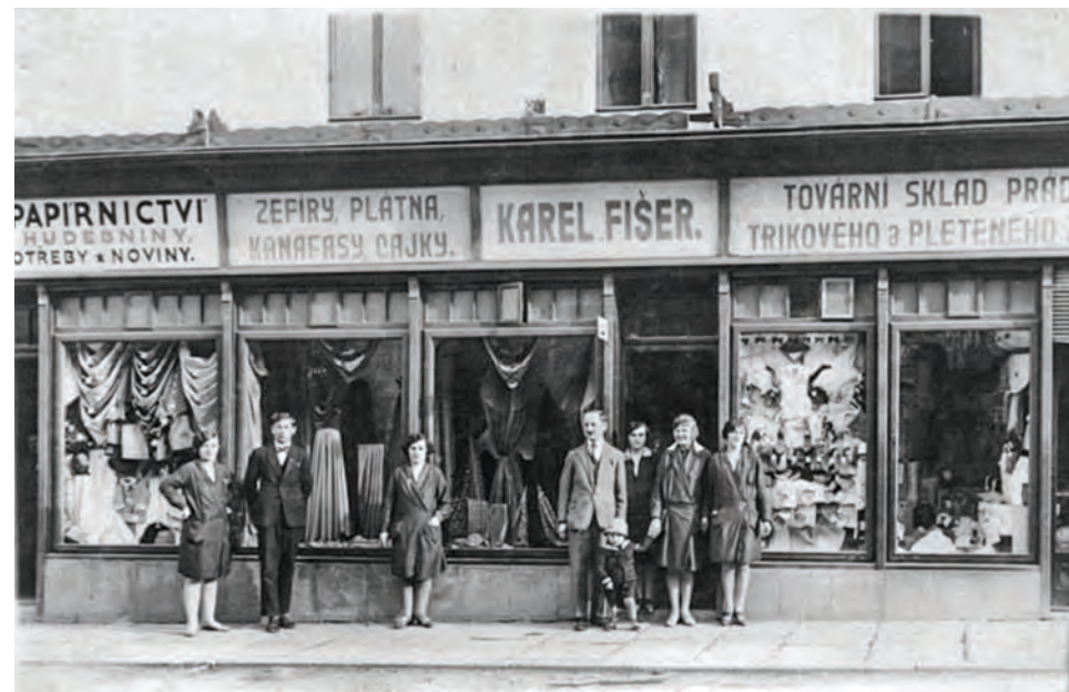
Prvorepublikový obchod rodiny Fišerovy kousek od kostela