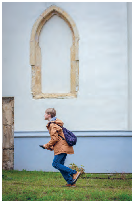
Dodnes můžeme zvenku na jižní straně kostelní lodi vidět lomené gotické oblouky někdejšího vstupu a původního okna

O jeho opravu a přestavbu v barokním slohu se v 18. století zasloužila majitelka panství Marie Terezie Savojská. Později následovaly další úpravy.