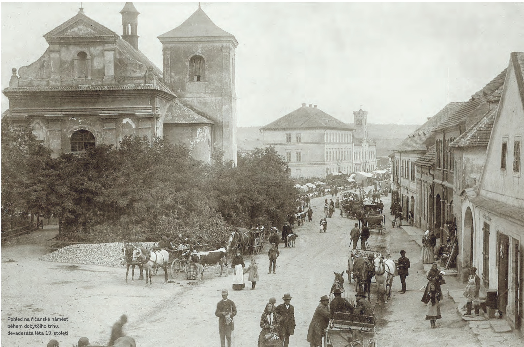
Pohled na říčanské náměstí během dobytčího trhu, devadesátá léta 19. století