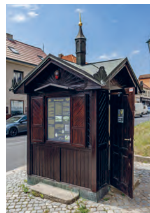
K připomenutí židovských obyvatel, kteří spoluvytvářeli říčanské dějiny, slouží na Masarykově náměstí infostánek ke „kamenům zmizelých“