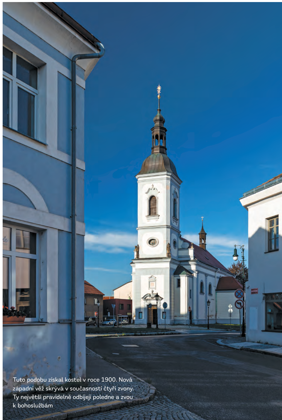
Tuto podobu získal kostel v roce 1900. Nová západní věž skrývá v současnosti čtyři zvony. Ty největší pravidelně odbíjejí poledne a zvou k bohoslužbám

Poznáte Petra od Pavla? Který z nich drží klíč od království nebeského?