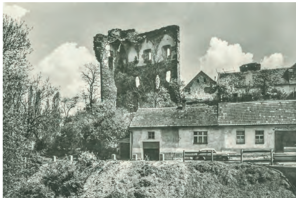
Fotografie hradu z padesátých let 20. století. Vpravo dole domek s provaznictvím

„Dnešním výrostkům rozhodně nedoporučuji to, co jsme prováděli my jako patnáctiletí kluci. Tehdy jsme se dokázali vyšplhat až na vrchol zchátralého hradního paláce, fotografovali jsme se tam a rozhlíželi. Ten pohled, který se nám naskytl!“