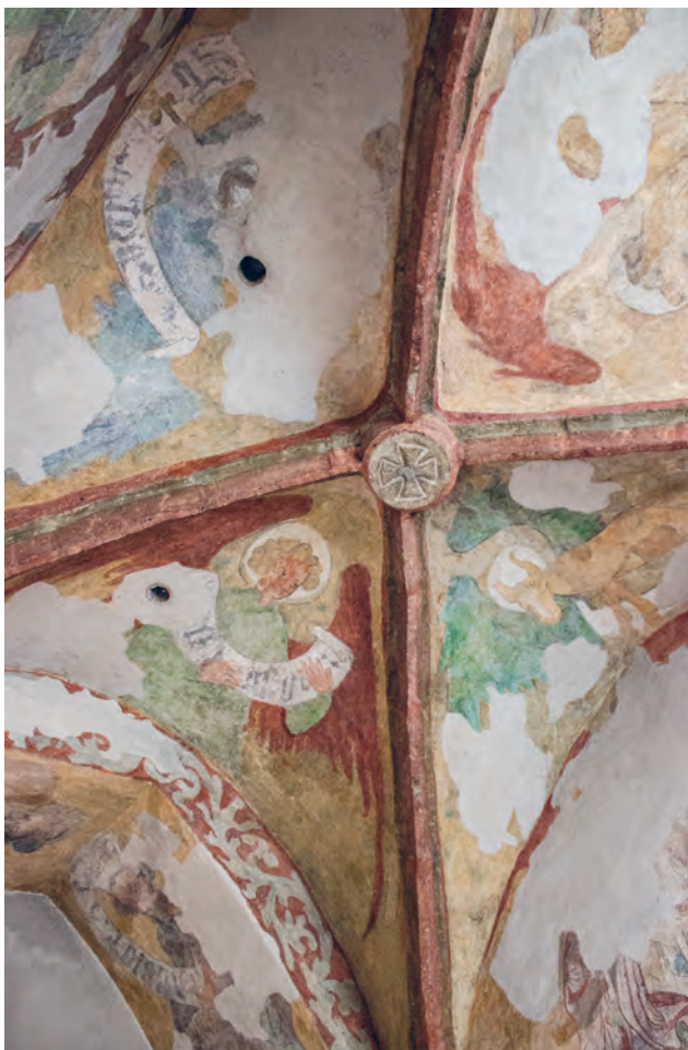
Na malbách rozpoznáváme postavy apoštolů a svatých. V horní části západní stěny se nachází zobrazení legendy o umučení 10 000 bojovníků

Pokud chcete vidět původní středověké fresky, které obdivovali už páni na říčanském hradě, nahlédněte při návštěvě nedalekého kostela do boční kaple. Je to místo, kde bývá o Vánocích vystaven betlém.