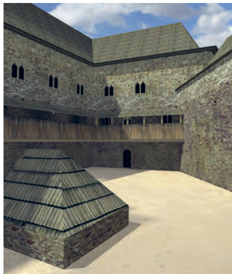
V roce 2020 vznikla vizualizace středověké podoby říčanského hradu, která je ke shlédnutí na YouTube kanálu Muzea Říčany

Jak říčanský hrad v době své největší slávy mohl vypadat? Okolí hradu obklopovaly dva rybníky, Mlýnský a dnes už zaniklý Lázeňský. Na východní straně navazovalo na hrad městečko s kostelem, které suplovalo jeho hospodářské zázemí. Od tohoto městečka hrad odděloval příkop. Samotný hrad měl patrně vnější (parkánovou) hradbu a vyšší hradbu vlastního jádra. Do ní byly zakomponovány velká věž, brána, palác i další palácové nebo hospodářské stavby. Palácová stavba byla nepochybně opatřena dřevěnou pavlačí, která usnadňovala komunikaci.