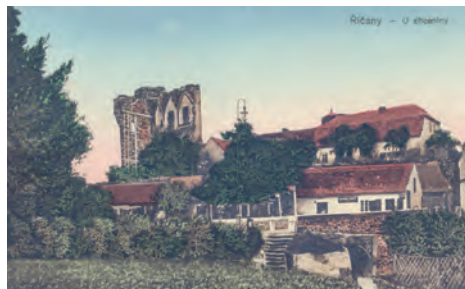
Záběr z míst, kde je dnes parkoviště. Z domků pod hradem dnes stojí už jen jediný, ten nejvíce vpravo

Teprve od 19. století se hrad začíná vnímat jako památka a už nedochází k jeho soustavnému poškozování. Stává se místem výletů i inspirací pro umělce a jejich díla. V průběhu 20. století dochází k sanaci hradního paláce, ovšem ani ta v roce 1991 nezabránila zřícení palácové klenby. V době zcela nedávné došlo k šetrnému zabezpečení hradní věže, která byla do té doby chráněna nevzhlednou kovovou sítí.