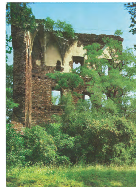
Pohled na dnes již neexistující klenební žebra paláce, sedmdesátá léta 20. století