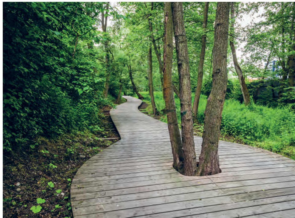
Díky dřevěným můstkům se dnes projdete i projedete na kole ještě nedávno špatně přístupným údolím

Od Mlejňáku se můžete vydat směrem na Kolovraty po dřevěných můstcích vybudovaných kvůli cyklostezce. Díky těmto citlivě postaveným chodníkům mohlo být tzv. Pohodové údolí zachováno ve své přírodní podobě s pokroucenými vrby a mokřadem. Na jaře tu rozkvétají orseje, později blatouchy, řeřišnice a devětsil, na srázu nad potokem také čemeřice rozšířené ze zahrad. Okolí rybníka je domovem pro celou řadu ptáků. U vody hledají potravu konipasové bílí, ve starých stromech hnízdí brhlíci nebo špačci.