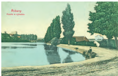
Mlýnský rybník na začátku 20. století