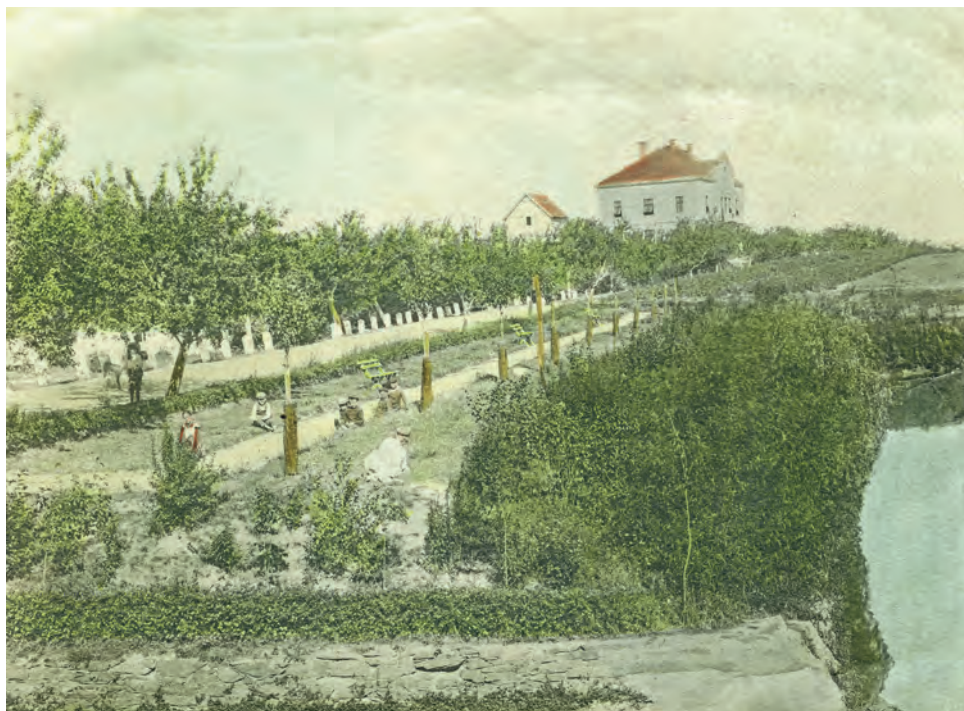
Pohled od kraje Mlýnského rybníka ke Kolovratské silnici na začátku 20. století