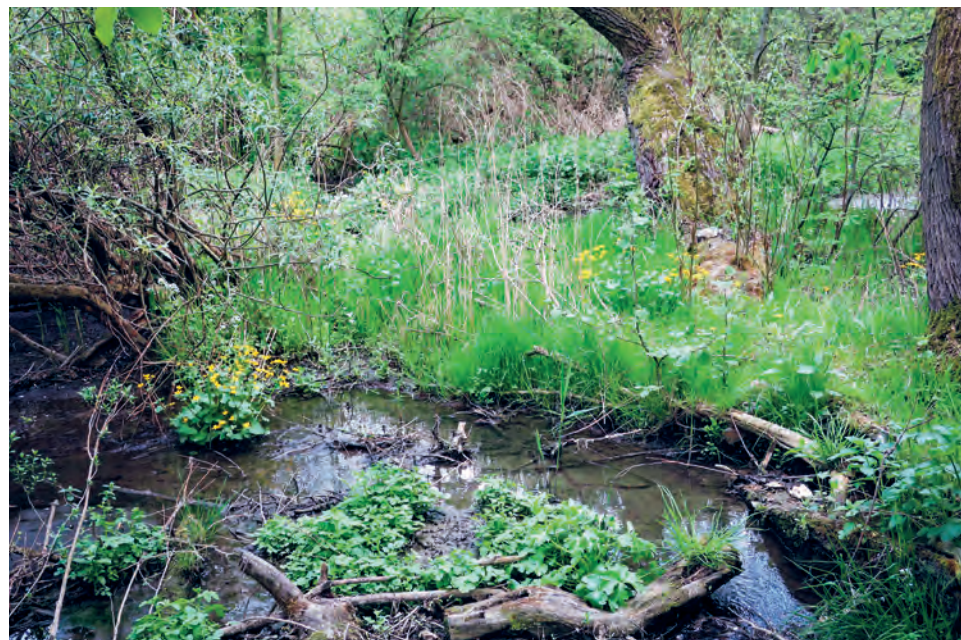
V podmáčené džungli pod dětským hřištěm na jaře rozkvétají blatouchy a řeřišnice

Rybník ožívají po celý rok hejna kachen, včetně kříženců kachny divoké a domácí a pravidelně také kachnička mandarínská. Návštěvníky možná v posledních letech překvapily neohrožené husy, které vypadají úplně jako husy divoké. Šlo však o husy landéské od chovatelky z domu pod zříceninou hradu. Podnikaly výpravy do okolních ulic a někdy také blokovaly cyklostezku. Nyní jsou po část roku součástí husího hejna u chovatele v nedalekém Kuří. Rybník je oblíbeným rybářským revírem, kde se obvykle loví kapři.