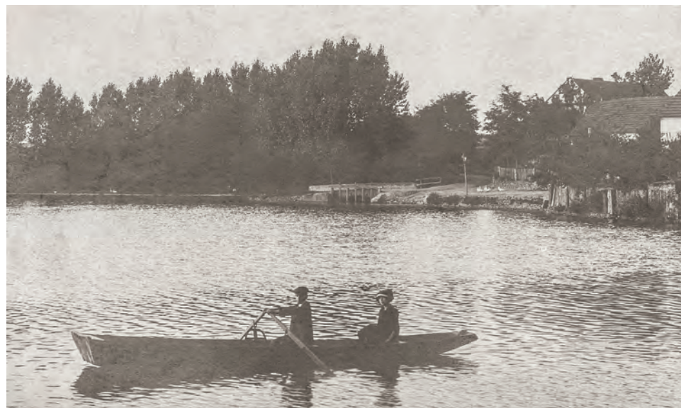
Lodičky na Mlýnském rybníku