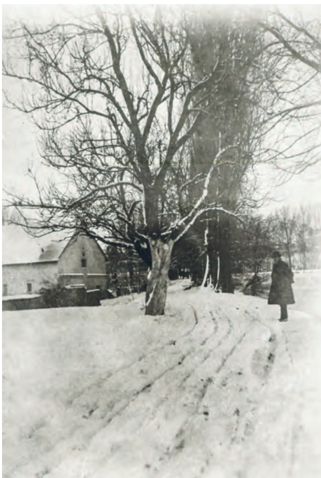
Mlýn v zimě 1931