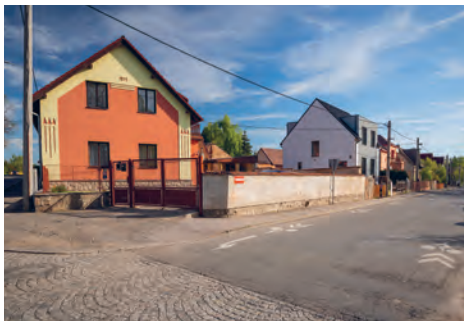
Na samém kraji ulice Podhrázská stojí dům, dříve statek rodiny Šobrov. Za první republiky jim patřilo největší povoznictví v této části Říčan