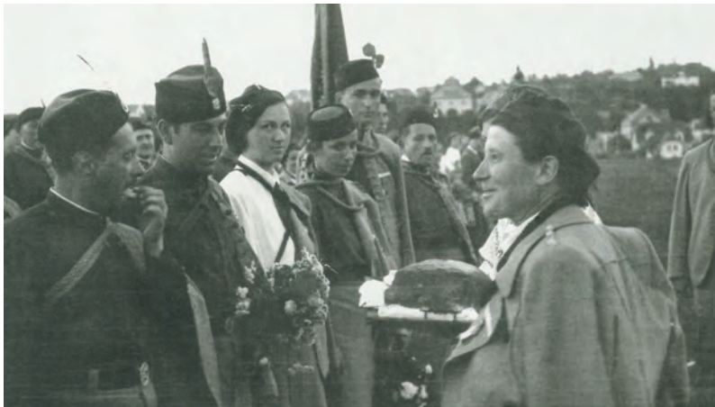
Sokolové na Fialce, patrně třicátá léta 20. století