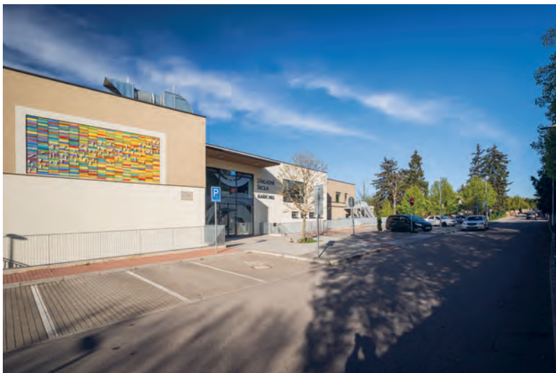
„Máme tu školu, školku, parkoviště, Fialku s bazénem, prostě hodně budov.“ (žák 3. třídy ZŠ Magic Hill ve výukovém programu Muzea Říčany)