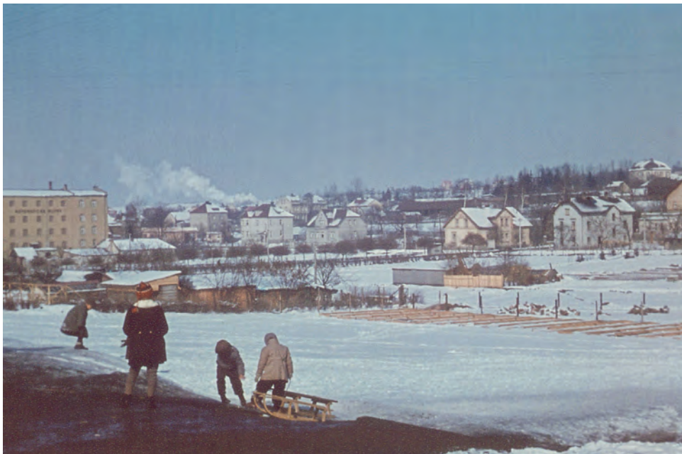
Sáňkování za zahradnictvím Fialových, rok 1942. Vzádu na snímku vidíme cestu lemovanou javory (dnešní Cestu svobody) a úplně vlevo budovu Bartošova mlýna