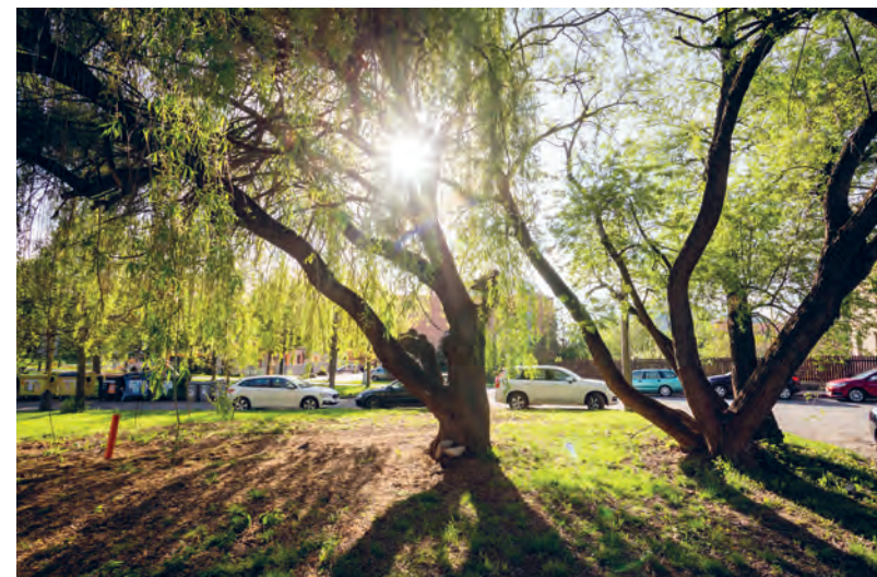
Ulice Mánesova dnes