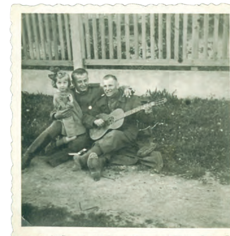
Vojáci v květnu 1945

Příslušníci tzv. Ruské osvobozené armády, útvaru, který vznikl v roce 1943 především ze sovětských zajatců a stal se součástí německé armády. V jejich čele stál generál Andrej Andrejevič Vlasov. Vlasovci se v květnu 1945 přidali na stranu Pražského povstání. Po válce se však jako zrádci ocitli v táborech nucené práce nebo byli popraveni.