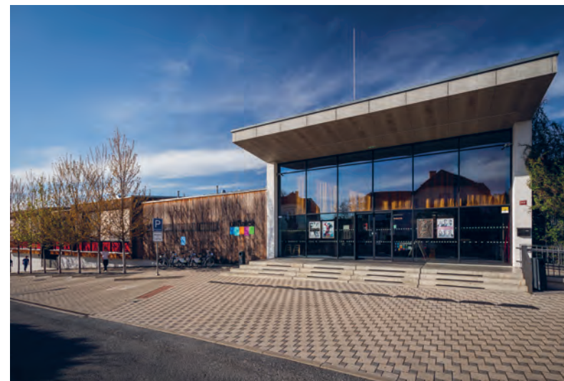
Sportovní a kulturní centrum Na Fialce

Centrum Na Fialce zůstává oblíbeným místem pro sportování, relaxaci nebo setkávání. Za sportem sem spousta lidí jezdí auty, přímo před vchodem se ale nachází jedno ze stanovišť sdílených kol ve městě. Součástí budovy je i sportovní hala s fasádou s popínavými rostlinami a zelenou střechou.