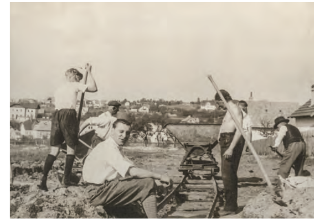
Budování letního sokolského hřiště, tzv. Sokoláku, na začátku třicátých let 20. století

Dnes, když do této části Říčán lidé docházejí do sportovní haly a bazénu centra Na Fialce a na travnaté ploše za ním trénují parkouristé, tak využití místa pokračuje ve stejném duchu.