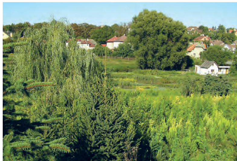
Fialka před výstavbou