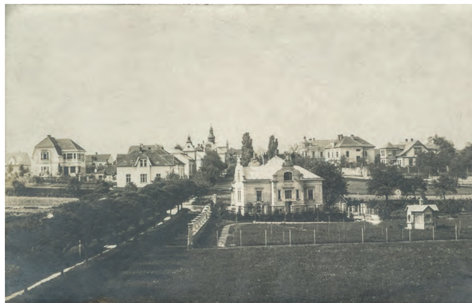
Secesní vila se světlou střechou s nápisem "Bezděkov", který upomínal na dobu, kdy se tu nacházel stejnojmenný rybník. Fotografie je z roku 1920