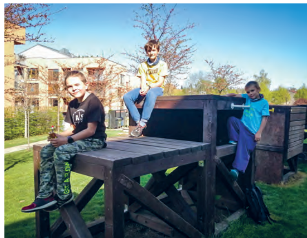
Ant Parkour Deadly Team Říčany, z tréninku