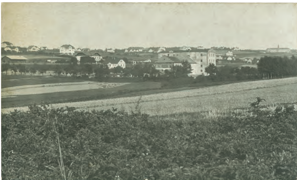
Silnice lemovaná stromy (dnes ul. 17. listopadu) vede v místě někdejší hráze rybníka Bezděkov. V pozadí je vidět, zcela mimo zástavbu, budova Olivovny

Louce se říkalo Bezděkov ještě na začátku 20. století. Tento název zachytil také Jan Petříček st. na mapě, která vznikala o několik desítek let později.