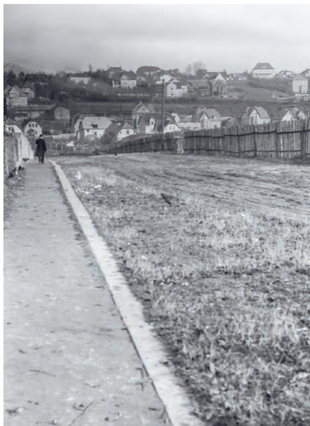
Pohled Sokolskou ulicí směrem k ulici Mánesově a Politických vězňů. Za ohradou vzniklo sokolské hřiště