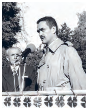
Na slavnosti promluvil i Karel Schwarzenberg, tehdejší kancléř prezidenta Václava Havla