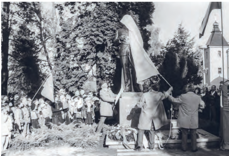
Slavnostní odhalení sochy 28. října 1990