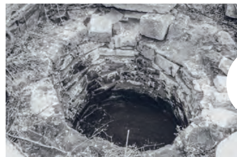
Studna ukryvající přes čtyřicet let tajemství zmizelé sochy

V roce 1946 byla socha Antonína Švehly znovu vztyčena, ale ne nadlouho. Po nástupu komunistů k moci byla opět stržena a uložena tentokrát na dvoře dnešní základní umělecké školy. Skupina mladých agrárníků se rozhodla,