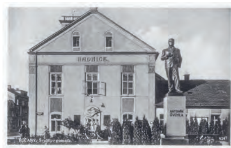
Původní umístění Švehlův sochy před radnicí v Říčanech