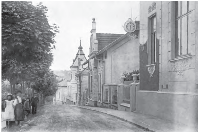
Cesta svobody, tehdy Sadová ulice, v roce 1912

Park Antonína Švehly je ve všedních dnech hlučné místo na dopravní křižovatce. Než narostla automobilová doprava ve městě, patřilo do klidné části v blízkosti původně secesních vil, které lemovaly cestu k nádraží.