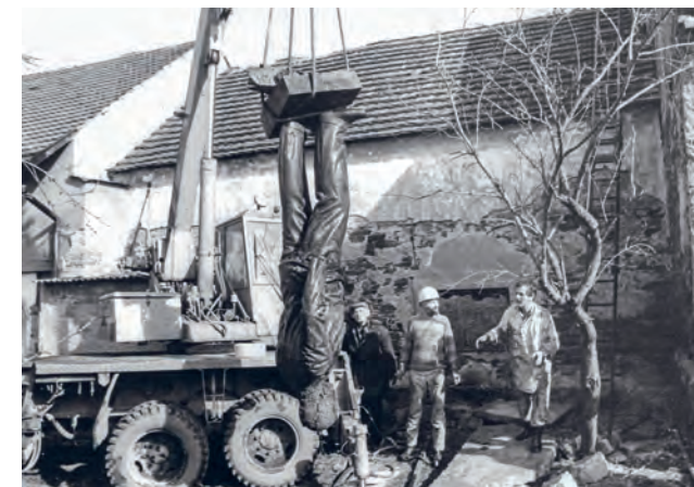
Vyzvednutí sochy ze studny v Lipanech po listopadových událostech 1989

Ty joo, udržet tak dlouho tajemství, to bych nevydržel!