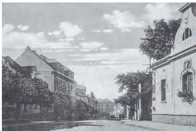
Cesta do centra města na konci dvacátých let 20. století

Kašna s vodotryskem se v parku objevila v sedmdesátých letech. Také dnes je vítaným zpestřením při procházce po Říčanech a dosud jediným vodním prvkem, který vás alespoň pocitově osvěží v rozpáleném letním městě. Nedaleko místa, kde dnes stojí Švehlova socha, bývala socha rudoarmějce. U ní se před listopadem 1989 konala shromáždění při příležitostech k připomenutí československo-sovětského přátelství. Místní lidé vojákovi říkali partyzán a když si u sochy dávali sraz, říkali, že se sejdou U Partyzána. Sochu nyní najdeme na hřbitově a je součástí památníku rudoarmějců padlých při osvobození Říčan a tří vězňů z transportu smrti.