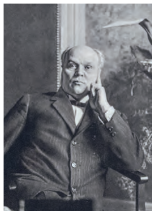
Antonín Švehla (1873–1933)

Byli to právě říčanští řepaři, kteří podnítli širokou veřejnost k tomu, aby Švehla zastupoval říčanský okres v rakouském parlamentu. Stalo se tak roku 1908. V následujícím roce postoupil do čela Republikánské strany zemědělského a malorolnického lidu (její členové se označovali jako agrárníci). Švehla se v parlamentu snažil prosazovat práva Čechů, a především českých rolníků, což se mu většinou dařilo