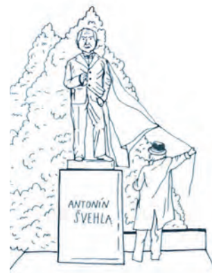
Kresba: Tereza Vostradovská (z animace Antonín Švehla a Říčany)

„Vládnout neznamená utiskovat, nýbrž poctivě a spravedlivě řídit. Náš sedlák je od přírody nadán řídit. On musí řídit a spravovat své hospodářství, ať je zle, nebo dobře. On neutká od svého pole, a proto já nesmím utíkat od vlády. Sedlák zaseje svá pole stejně, i když ví, že budou padat kroupy.“