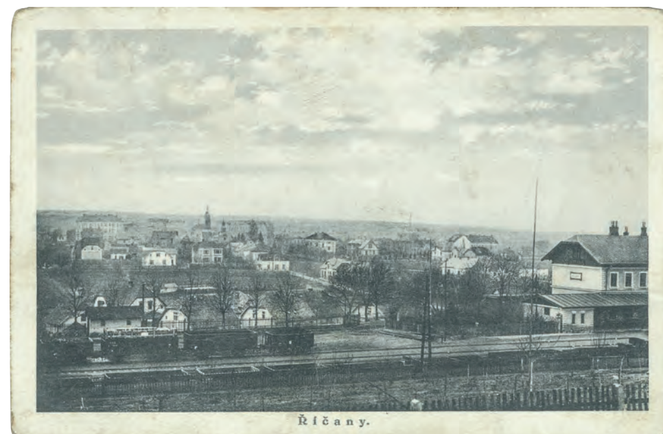
Pohled z místa nad tratí z roku 1928. Všimněte si, jak se za tu dobu změnil počet domů pod nádražím