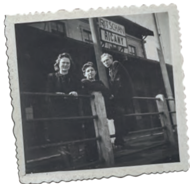
Na peróně říčanského nádraží na konci druhé světové války