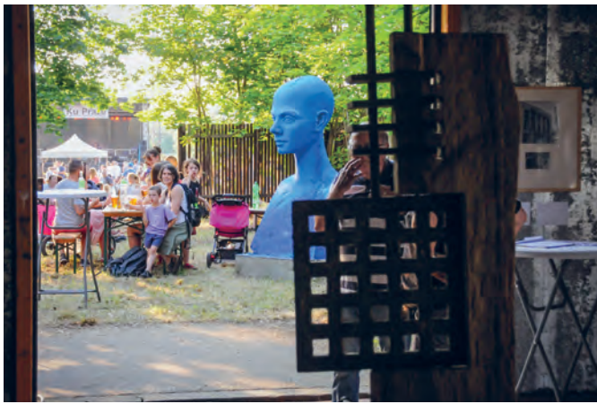
V rámci Industry Art Festivalu na jaře 2018 byla v bývalém drážním skladu zřízena galerie plná obrazů, fotografií i objektů s komentovanými prohlídkami za účasti většiny autorů