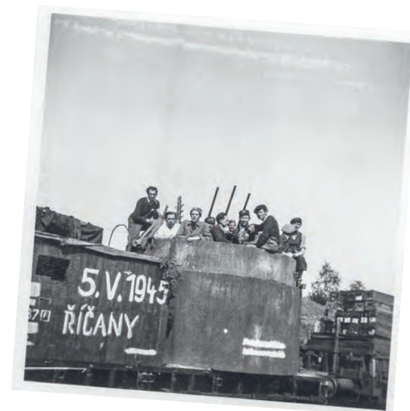
Obrněný vlak, který obsadili povstalci