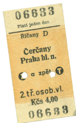
Jízdenka na kartičce z tvrdého kartonu, sedmdesátá léta 20. století

Zprovoznění železniční trati Praha-Benešov na dráze císaře Františka Josefa I. v roce 1871 bylo pro obyvatele Říčan a okolních obcí skutečnou revolucí. Hlavní město se tak přiblížilo pro dojíždění za studiem a za prací. Pražané se zase rychle dostali do venkovského prostředí a objevovali městečko s rybníky a lesy pro výlety i letní pobyt. Nejprve tu byla jen zastávka, v roce 1874 vzniklo malé přízemní nádraží, umístěné oproti pozdější budově blíž k Praze. Větší patrová budova dokončená roku 1894 pak sloužila až do roku 2008.