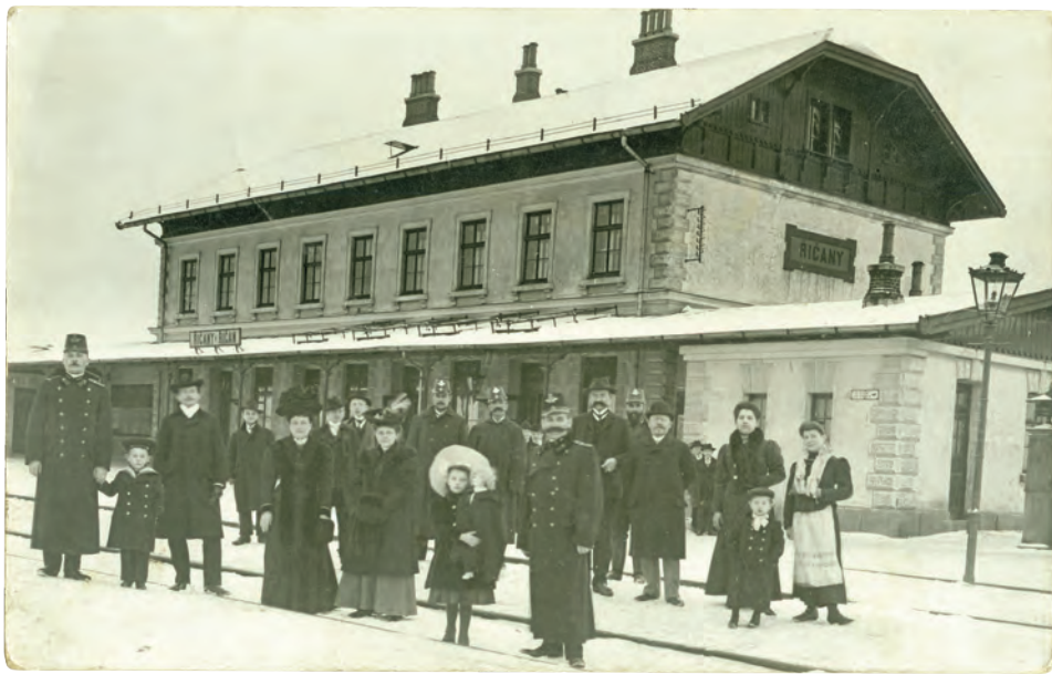
Drážní zaměstnanci seřazení na kolejích před budovou nádraží, začátek 20. století