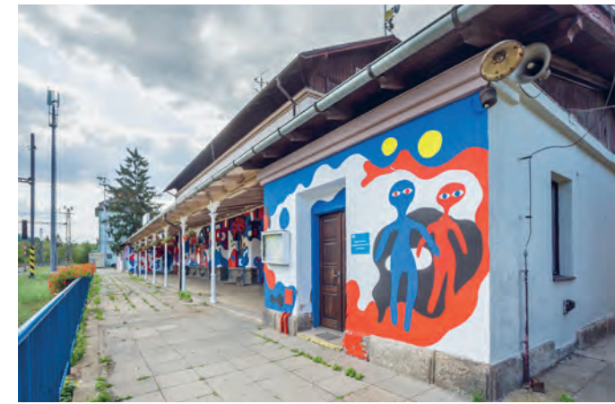
Barvy trikolory na fasádě nádražní budovy