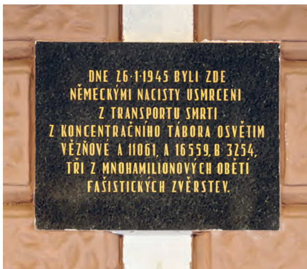
Pamětní deska na říčanském nádraží

Na začátku roku 1945 stál několik hodin na nádraží kvůli poruše vlak smrti. Tři vězni se pokusili shrábnout sníh, aby se napili – hlídkující esesáci je zastřelili a nechali ležet v blízkosti kolejí. Jsou pohřbeni na místním hřbitově. Jejich jména neznáme, jen čísla, která měli vytetovaná na předloktí.