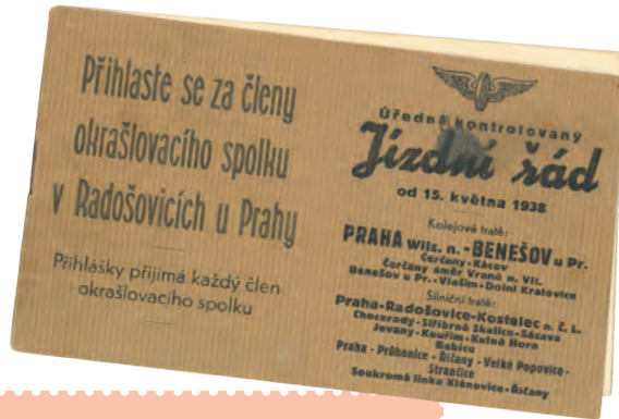
Jízdní řád z roku 1938

„Nádraží bývalo v době mého mládí upravené. Pořádek, který tam vládl, se moc nezměnil od dob císařství. Množství zaměstnanců pracovalo jak uvnitř, tak venku, například vymetali výhybky a čistili lampy. Ty byly všude ještě petrolejové. Na vše dohlížel přednosta stanice, který na nádraží i bydlel.“