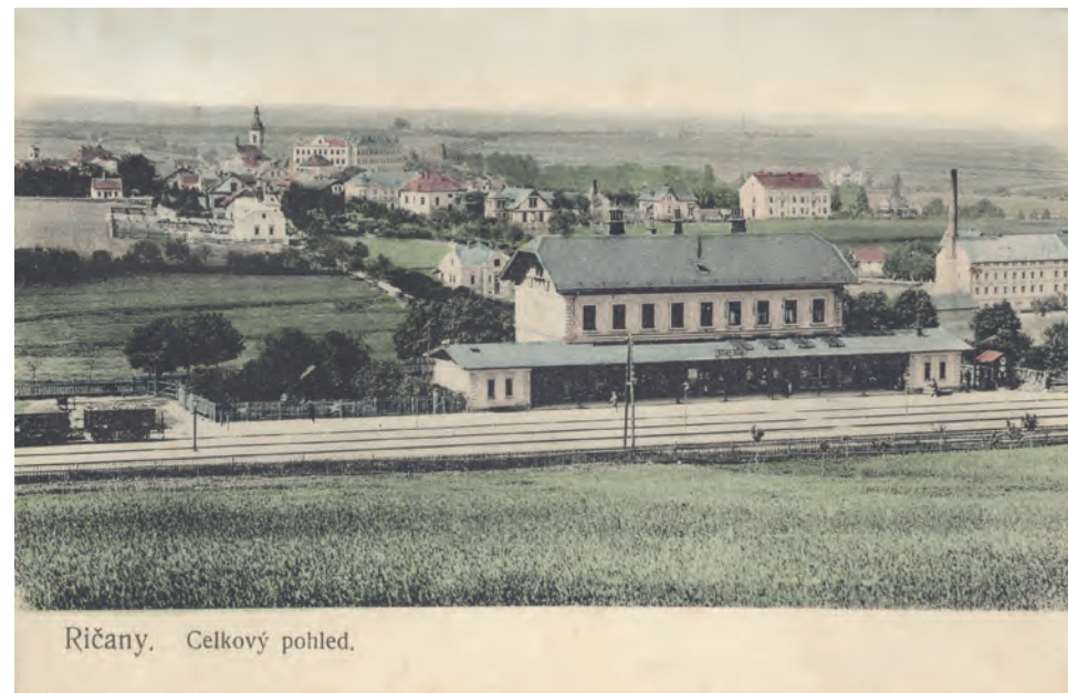
Kolorovaná pohlednice z počátku 20. století