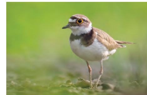
Kulík říční

Dusík a zejména fosfor zůstávají dlouho v sedimentech na dně, proto bylo nutné obě tyto nádrže nad Marvánkem postupně odbahnit, jinak by zdejší voda už nikdy ke koupání nebyla. Bagrování ale stojí miliony, žádná obec nechce odbahňovat rybníky opakovaně. Jak se tedy zbavit živin? Rybníky se už od středověku tradičně letnily. To znamená, že některá léta zůstávaly vypuštěné a na dně pak vyrostly z živin různé rostliny,