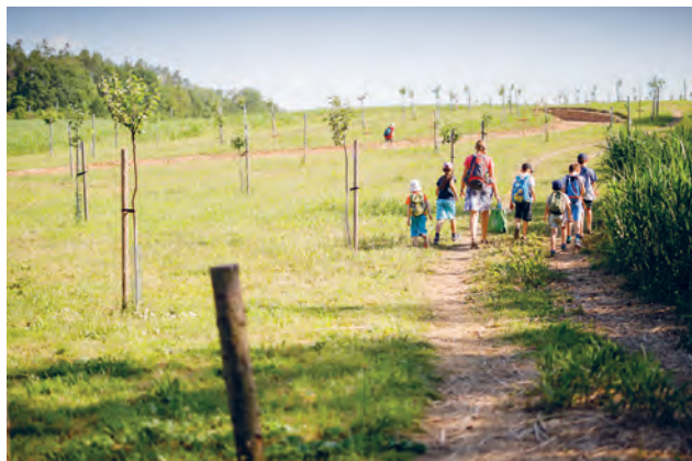
Nově vysazený sad Srnčí před dokončením cyklostezky

Nad Srnčím rybníkem byl vysazen za finančního přispění firmy Billa sad Srnčí se starými odrůdami jabloní a hrušní, kdouloněmi a mišpulemi. Je zde přístřešek a naučné cedule. Tato Ladova ves se stává oblíbeným cílem výletníků.