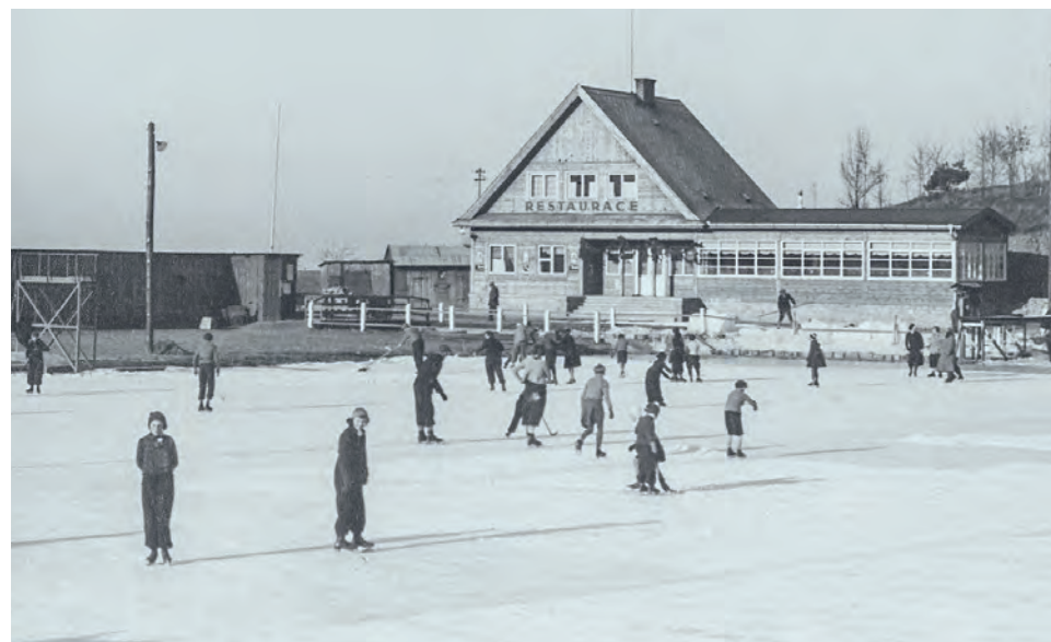
Zimní radovánky na Jurečku v časech minulých