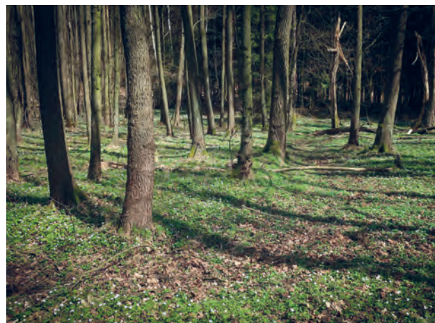
Údolí Rokytky s rozkvetlými sasankami

Na stránkách nad Jurečkem dnes rostou borovice, některé z nich nedávno uschly kvůli extrémnímu suchu. Okolní les tvoří také listnáče, hlavně habry, na jaře pod nimi rozkvétají trsy sasank a později konvalinek. Výsadby smrku napadené kůrovcem byly v posledních letech odtěženy a paseky se zalesňují především duby a jedlemi.