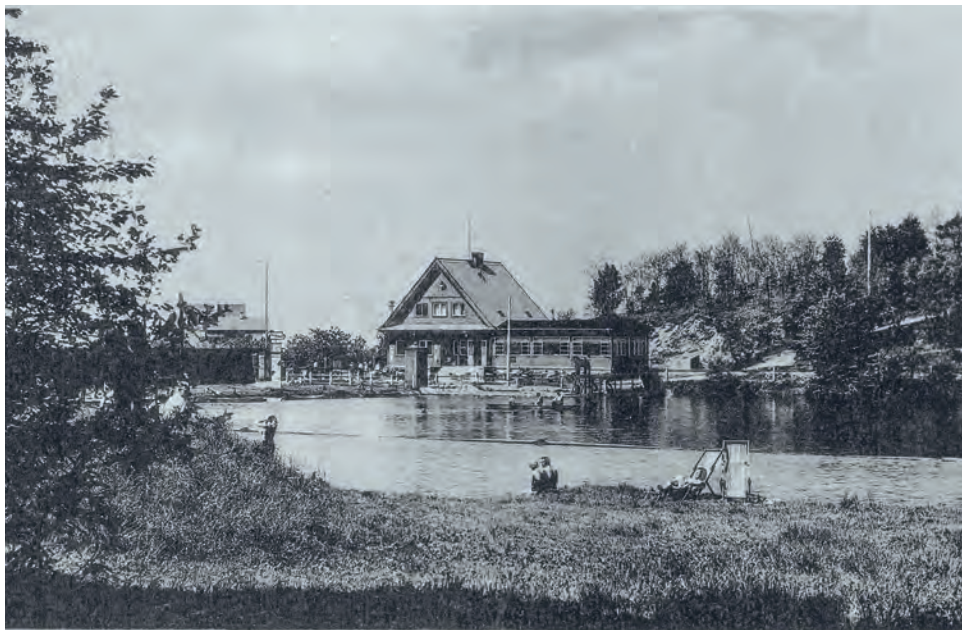
Areál koupaliště ve čtyřicátých až padesátých letech 20. století

V údolí Rokytky stávala až do třicetileté války obec Přestavlky, která byla podobně jako další obce v okolí (Pacov, Janovice, Radošovice i Říčany) zničena švédskými vojsky. Na rozdíl od nich nebyla znovu obnovena, ale údolí zůstalo částečně odlesněné, louky využívali pravděpodobně obyvatelé nedalekého Strašína. Na konci 19. století místo objevili výletníci.