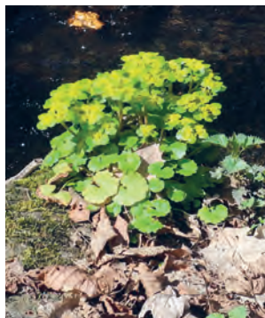
Na břehu rozkvétá na jaře mokřýš střídavolistý

dně se usazovalo jemné bahno, sediment, z kterého vznikly zdejší břidlice. Úlomků břidlic si můžete všimnout na dně Rokytky nebo na skalce proti tenisovým kurtům, kde bývalo vyhlídkové místo zvané Hříbek či Klobouk. Z podobných břidlic byl zbudován také říčanský hrad. Procházkou kolem Rokytky po čase dojdete dál k lomům na říčanskou žulu a potok získá díky žulovým balvanům svoji romantickou podobu.