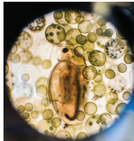
Perloočka pod mikroskopem

Když budete mít štěstí, potkáte na letní procházce kolem Jurečku perleťovce