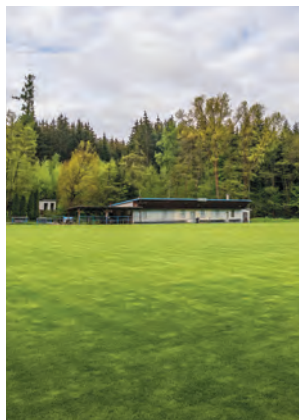
Fotbalové hřiště dnes

Za Jurečkem vznikly ve dvacátých letech tenisové dvorce, o kousek dál se hrával a stále hraje fotbal. V prudkém kopci vedle tenisových kurtů vedla sáňkařská dráha. Vlhká louka u Rokytky byla tehdejšímu sportovnímu klubu přidělena v roce 1937, koryto Rokytky bylo přesunuto a v roce 1939 bylo slavnostně otevřeno fotbalové hřiště, které FK Radošovice slouží dodnes. V roce 2021 vedle něj vyrostlo dětské hřiště a další hřiště pro plážový volejbal.