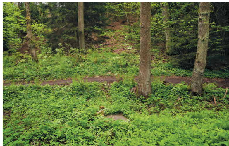
Místo, kde se nacházelo lesní divadlo, dnes připomínají jen betonové základy nápořední budky