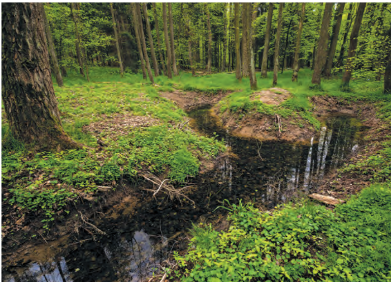
Nově vybagrovanou tůňku hned první rok zabýdly stovky pulců