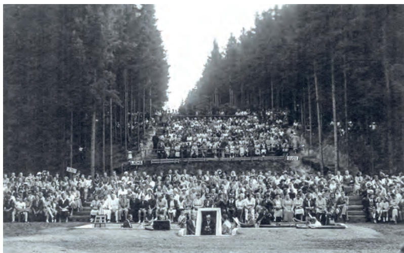
Záběry z hlediště a jeviště lesního divadla z poloviny třicátých let 20. století