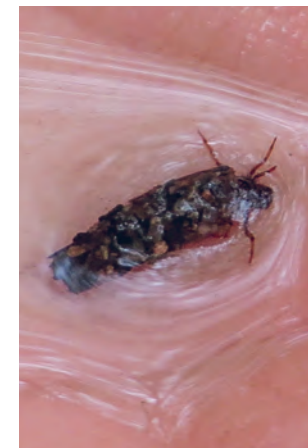
Přítomnost larev chrostíků ukazuje čistotu vod (tzv. bioindikace). Pozorovat je můžete nad jezem

Do Rokytky také přichází voda přes čistírnu odpadních vod v Tehovci, která musí odstraňovat znečištění nejen z domácností, ale také například z průmyslových provozů u Černokostelecké. Na Rokytky tak můžete potkat často nevábně vyhlížející chuchvalce pěny, z kterých jen některé mají přirozený původ v huminových kyselinách z okolních rašelinových lesů.