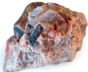
Vzácnou příměsí v říčanské žule je černý turmalín (skoryl)

V zarostlém lomu můžete objevit černý turmalín – skoryl –, na který upozorňuje i tabule naučné stezky. Vyskytuje se ve zdejší žule ve formě jehličkovitých křehkých struktur. Kromě estetických kvalit je také důležitým zdrojem boru. Tento poměrně vzácný prvek má široké využití od léčby očních chorob až po regulování reakcí v jaderných elektrárnách. Na Říčansku se před rokem 1989 uvažovalo o jeho těžbě, ve strategickém plánu města je tato oblast stále uváděna jako možný zdroj tohoto prvku.