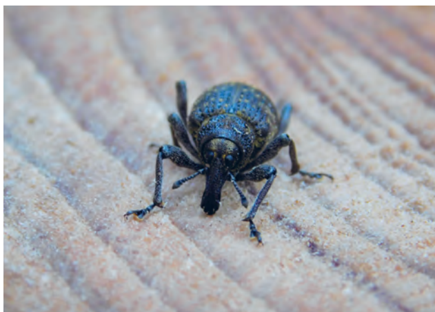
Vlevo klikoroh borový, dole střevlík kožitý

řadu druhů tesaříků pod padlými kmeny, večer na cestičce potkáme pobíhající masožravé střevlíky hladkého, zahradního a kožitého.