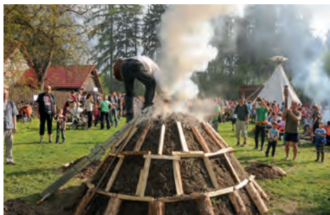
Pálení dřevěného uhlí v milíři mohli pozorovat návštěvníci hájovny v roce 2014