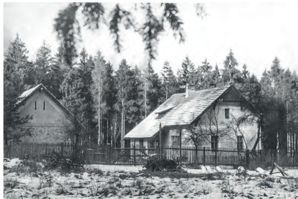
Hájovna v roce 1955