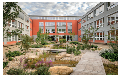
Dešťová voda ze střech nebo zpevněných ploch může být svedena do dočasného potoka a vsakovat se v dešťovém biotopu jako v atriu 3. ZŠ u Říčanského lesa v Říčanech.

K cestě do školy bez aut můžete motivovat celou školu jeden den v roce – Den bez aut (22. 9.), nebo klidně celý měsíc – např. květen. Pomohou k tomu atraktivní ceny jako vstupenky na laser game nebo do trampolínového parku ( ZELENÉ CESTY DO ŠKOLY ).