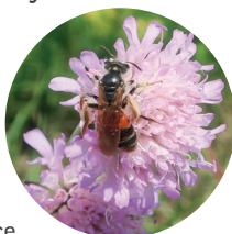
Samotářská včela na květu chrastavce

Znáte někoho ve svém okolí, kdo je nadšený včelař nebo ochránce přírody jako prof. Velflík? Jsou ve vašem okolí vysety a udržovány pásy lučních rostlin pro medonosné i samotářské včely?