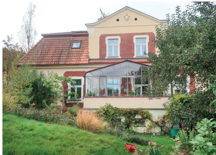
Dnešní pohled ze zahrady