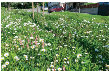
Kvetoucí pás lučních rostlin (prosadila Petra Podařilová)