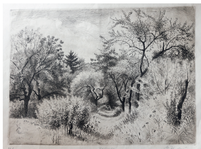
Zahrada, grafika Milady Kazdové-Hirkové

Průměrný dům ztrácí okny přibližně čtvrtinu tepla. Zakroužkujte dům, který je podle vás nejméně náročný na vytápění. Váš odhad diskutujte se spolužáky.