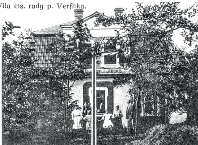
Pohled z ulice na začátku 20. století