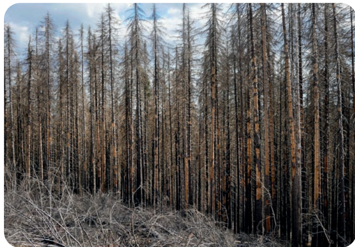
Na kůrovcem napadený les není veselý pohled. Ilustrační foto. Zdroj: pixabay.com

Smrk původně roste v horských oblastech s chladnějším podnebím a s dostatkem srážek. Mimo svůj přirozený areál se smrk stává méně odolným proti polomům, suchu nebo napadení škůdci. V současnosti jsou smrkové lesy v Česku ohroženy lýkožroutem smrkovým neboli kůrovcem.