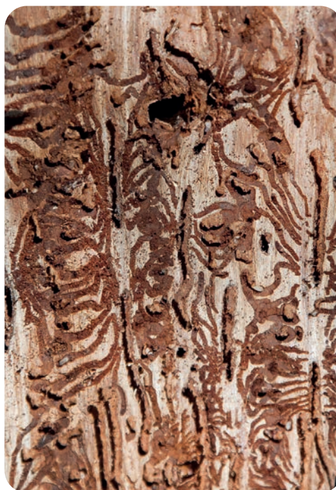
Chodbičky, které kůrovci vykusují v lýku napadených stromů, se nazývají požerky.