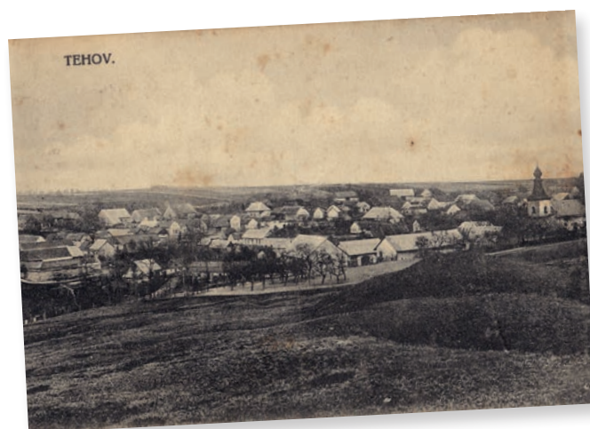
Stará pohlednice – pohled z třešňovky na obec.

Od třešňovky je krásný výhled na Tehov. Vidíte dům, ve kterém bydlíte, nebo dům vašich sousedů či spolužáků? Prohlédněte si staré pohlednice focené ze stejného místa, kde právě stojíte. Co se v průběhu let změnilo?