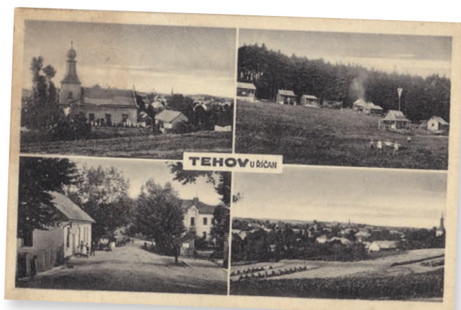
Pozdrav z Tehova.