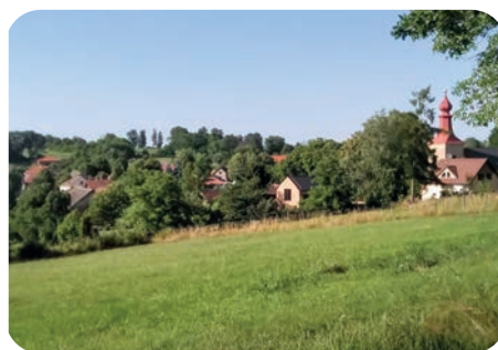
Výhled na Tehov z třešňovky.

Chodil do lesní školky někdo z vás? Jaké má na tuto dobu vzpomínky? Jak se čas trávený v lesní školce liší od školky klasické? A co mají obě školky společného?