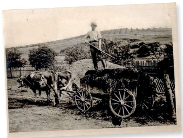
Jak vypadala nově vysazená třešňovka? Prohlédněte si ji na pozadí snímku s tehovským sedlákem Františkem Císařem.